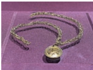
▲後拜占庭時期的硬幣項鏈