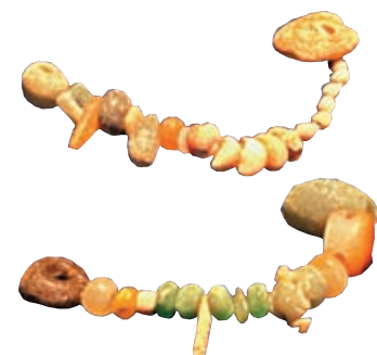
◀新石器時期的納克索斯島項鏈

記者就看到一枚男性佩戴的圖章戒指，戒指上雕刻了一個三座塔樓的城堡，石砌的牆壁、燕尾式的城垛和雙門的大門。這是一件珍貴的法蘭克（十字軍）的珠寶首飾，戒指的主人無疑是身份顯赫之人，甚至有可能就是城堡的主人。