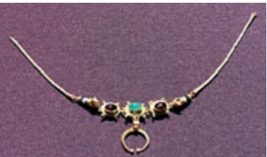
▲流行於公元前4世紀下半葉至羅馬時期的新月項鏈