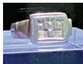
◀雕刻了一個三座塔樓的城堡戒指