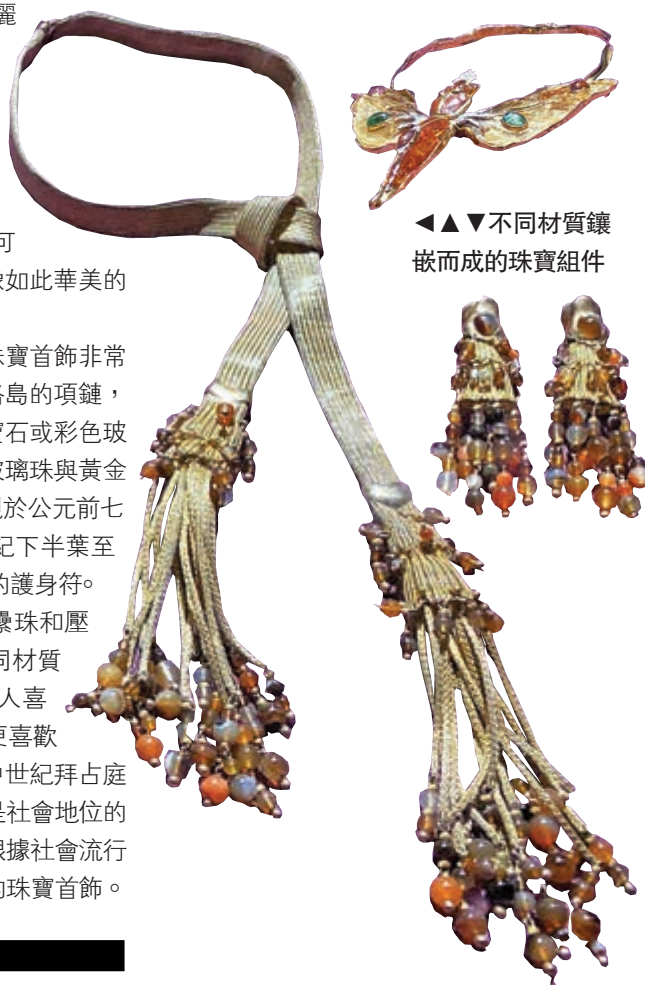
◀◀◀不同材質鑲嵌而成的珠寶組件