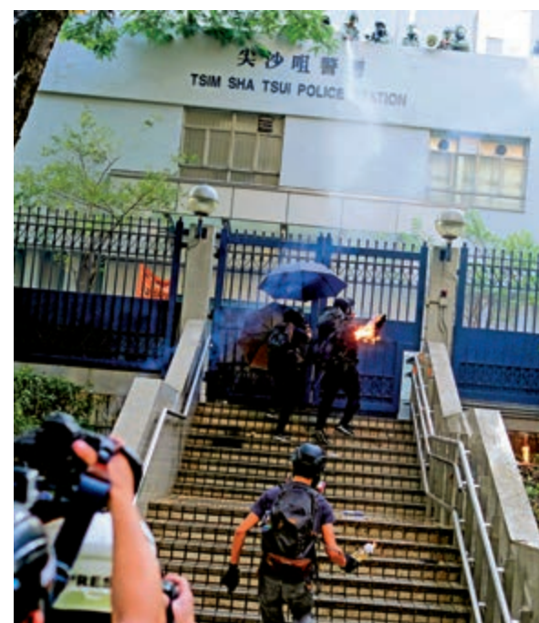
▲暴徒昨向尖沙咀警署瘋狂投擲汽油彈