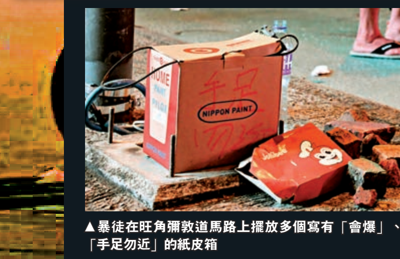
▲暴徒在旺角彌敦道馬路上擺放多個寫有「會爆」、「手足勿近」的紙皮箱