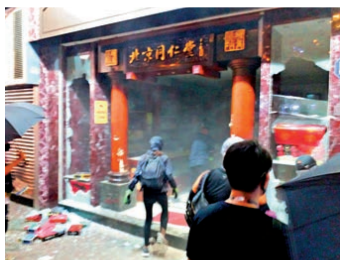
▲北京同仁堂遭暴徒打爛玻璃，放火搶掠