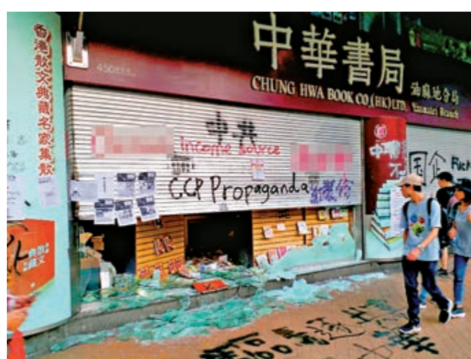
▲油麻地中華書局遭強行拉起鐵閘破壞，書籍散滿一地，一片狼藉

「泛暴派」昨再在九龍區煽動非法遊行，大批暴徒乘機在尖沙咀、油麻地、旺角、太子等地區大肆破壞，打砸中資商店，偷竊搶劫，到處縱火，又高空投擲汽油彈襲擊警察，有警長頭着火二級燒傷。多名暴徒身穿避彈衣假扮警方「速龍」小隊成員搞事破壞，企圖縱火後嫁禍警方。傍晚時分，警方在太子引爆疑似爆炸品，其後暴徒在旺角擺放多個懷疑爆炸品，危機四伏。