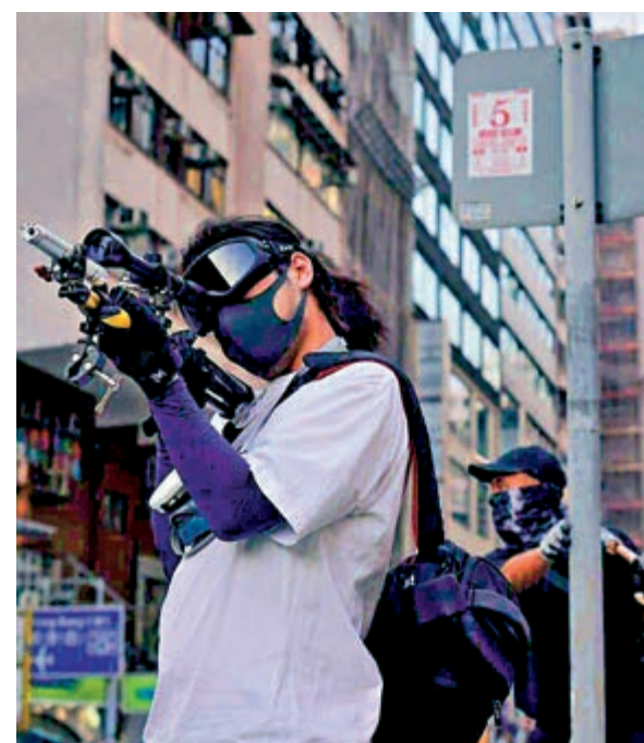
▲網上圖片可見，有暴徒將超級鎗槍配合瞄準器使用，專攻警員眼睛