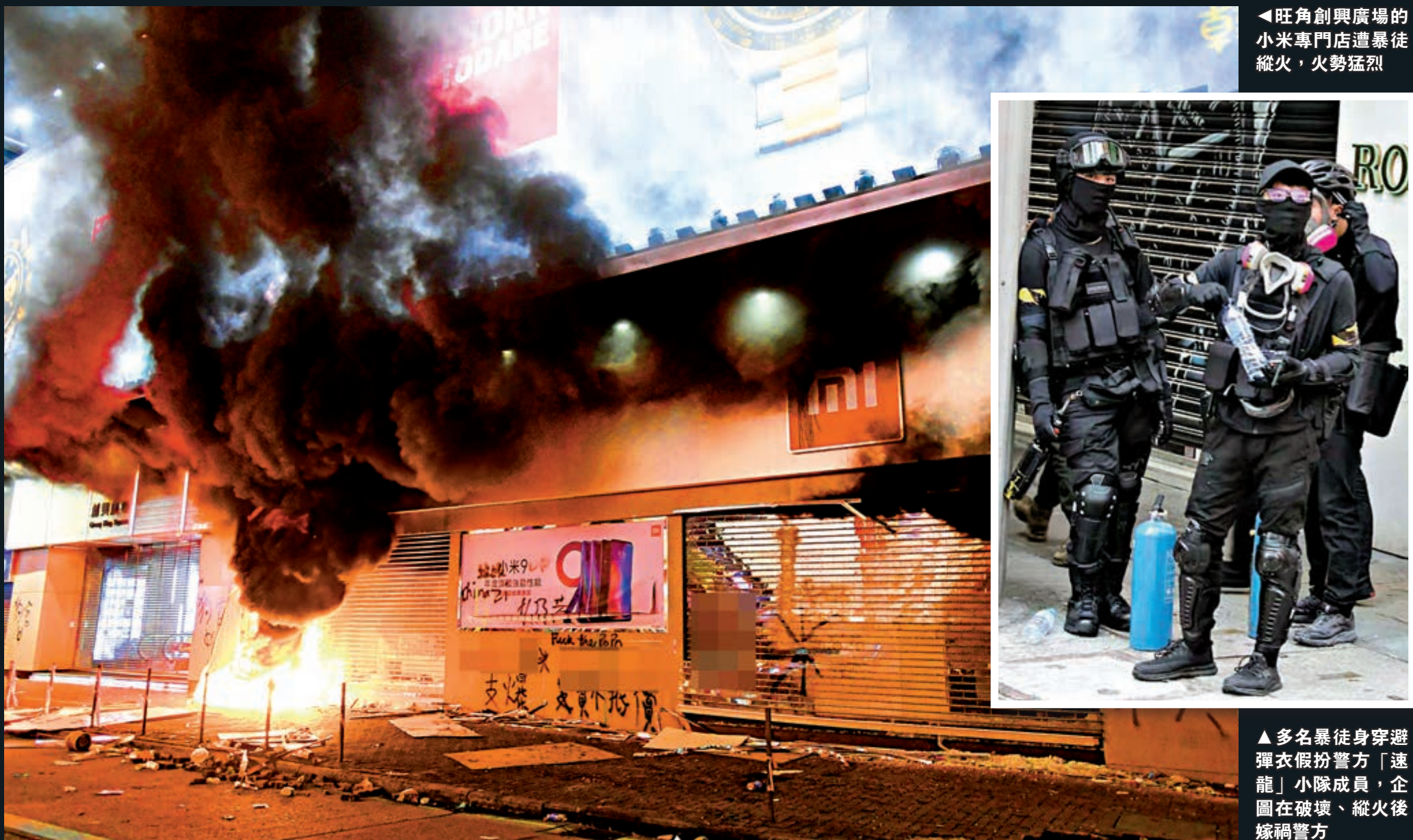
旺角創興廣場的小米專門店遭暴徒縱火，火勢猛烈