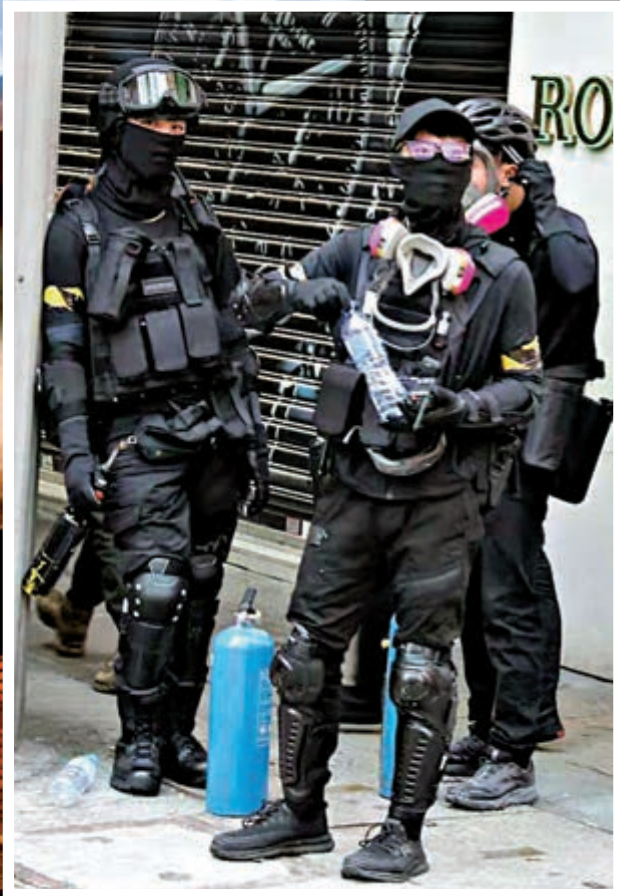
多名暴徒身穿避彈衣假扮警方「速龍」小隊成員，企圖在破壞、縱火後嫁禍警方