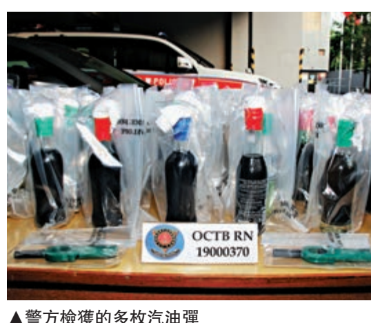
▲警方檢獲的多枚汽油彈