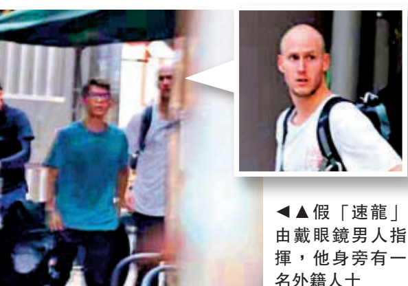
▲假「速龍」由戴眼鏡男指揮，他身旁有一名外籍人士

昨日下午在彌敦道與旺角道交界，有六至七名暴徒身穿與「速龍」相似的服飾裝備，部分人身穿避彈衣，手臂綁有黑黃色的記號。有人拿着黑色圍布，亦有人拿着滅火筒、鐵槌及疑似燒焊槍等。行至上海街位置，「A貨速龍」發現自己與警方只有10米距離，立即逃到窄巷換衫「金蟬脫殼」。記者又發現，這批暴徒由一名戴眼鏡的男士指揮，而他身旁有一名外籍人士。最終他們都逃去無蹤。