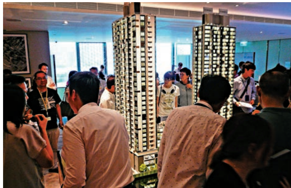
按揭成數提升，對中產階層置業有一定的幫助

計劃，短中期對發展商都有裨助，即可將他們手上的閒置土地加速孵化為熟地發展，加上按揭成數提升，對中產階層置業有一定的幫助。地產股成為上周升幅較大的項目。不過，炒風過後，回吐壓力又告出現，個別有「打回原形」的危險。