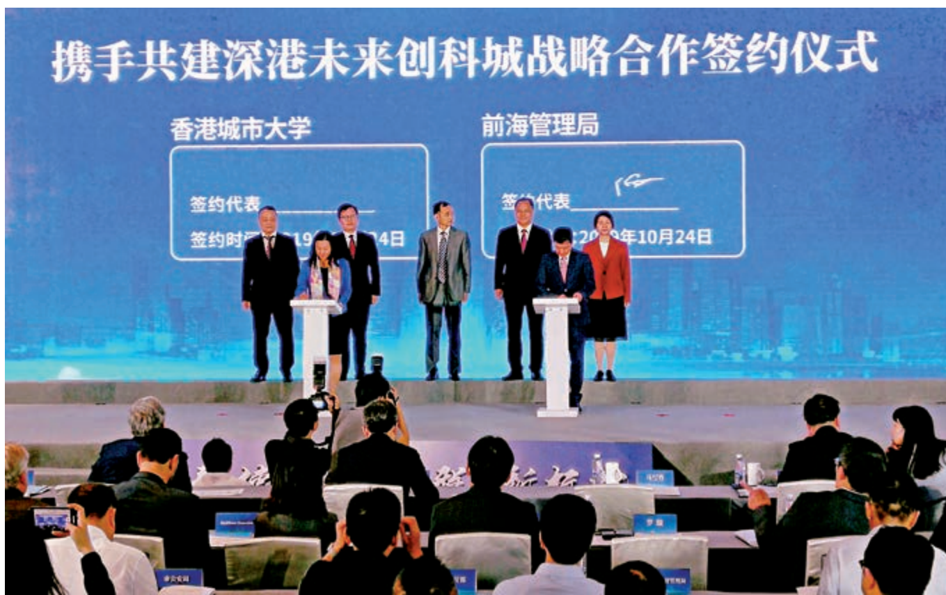
▲24日，多個深港合作項目簽約落地前海。圖為前海管理局與香港城市大學簽署戰略合作框架協議。

前海企業開辦「一窗通」也於當天正式發布。進駐前海企業可透過「一窗通」實現商事登記、公安、稅務、社保、銀行等部門線上線下互聯互通，辦理營業執照、申領發票、刻製公章、社保登記、銀行開戶並聯辦，且可在1個工作日全部完成。