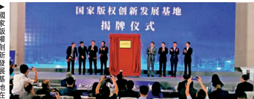
▶國家版權創新發展基地在前海正式揭牌。