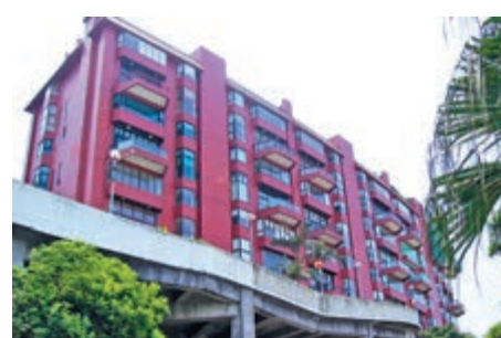
▲嘉頓麵包家族後人剛沽出Altadena House複式戶

白加道27號，早於1974年落成，提供18個單位，對上一宗成交為2016年4月，為低層B室，以2.6億售出，呎價63835元。經濟放緩，九龍站豪宅現減租招徠，天璽一伙早前被「撻租」的1房戶，最終減價