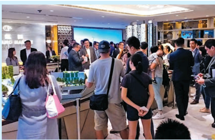
明翹匯售樓處人頭湧湧

新世界（00017）元朗瓏頌一組客以逾1167萬元買入2伙，分別為2樓及25樓B3室，單位實用面積308呎，後者為天台特色戶，成交價619萬元，呎價20097元，創項目新高。而一房特色戶亦已沽清。項目累售217伙，佔可售單位近8成，套現逾11.4億元。