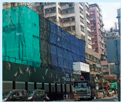
家壹擴大建期折扣額