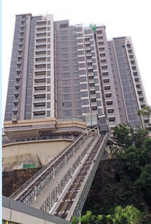
意堤提高一按成數至85%