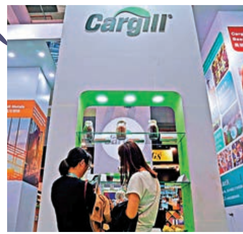
▲美國農業巨頭嘉吉於去年上海進博會上的展覽攤位 網絡圖片