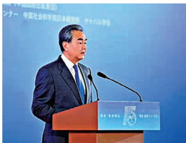
▲26日，國務委員兼外長王毅在北京出席第15屆「北京—東京」論壇開幕式並致辭

【大公報訊】據中新社報道：中國國務委員兼外長王毅26日在北京出席第15屆「北京—東京」論壇開幕式並致辭時強調，中日兩國應當加強更具戰略性的多邊合作。旗幟鮮明捍衛以聯合國為核心的國際體系，旗幟鮮明捍衛多邊主義和自由貿易，攜手應對全球性挑戰，推進完善全球治理，為當今世界注入更多的穩定性和正能量。