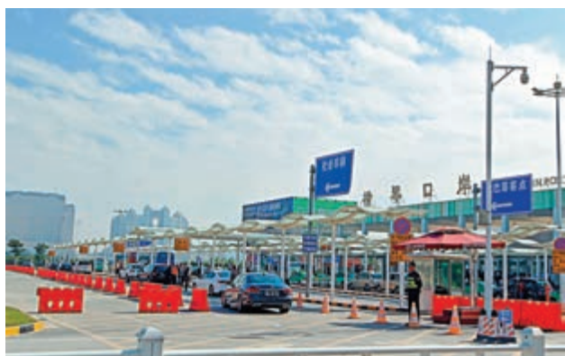
▲全國人大常委會授權澳門特別行政區對橫琴口岸澳方口岸區及相關延伸區實施管轄

澳門特區政府發言人辦公室26日表示，全國人大常委會上述決定，充分體現中央對澳門融入國家發展大局的高度支持，對推進粵港澳大灣區建設、加強澳門與內地基礎設施互聯互通、提高通關便利化水平、促進人員和貨物等生產要素便捷流動具有重大意義。