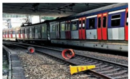
▲東鐵紅磡站及旺角站之間路軌發現被投擲垃圾桶及雪糕筒，嚴重影響行車安全

車長留意到對面線，即往羅湖/落馬洲方向的路軌上有外來物件，立即通知車務控制中心。車務控制中心安排人員進入路軌範圍，檢走了三個「雪糕筒」及一個垃圾桶。東鐵線服務於下午約4時50分陸續回復正常，服務受阻約10分鐘。