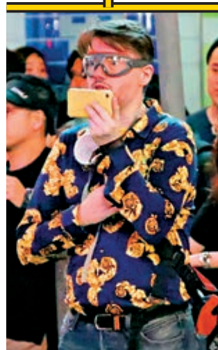
▲洋指揮疑似以手機指揮暴徒行動

有讀者曾爆料指，荃灣一間教幼兒英語的外籍老師與「Hong Kong Hermit」貌似。