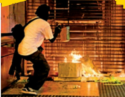
▲暴徒在旺角多個港鐵站出口放火，全然不顧市民生命安全