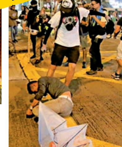
▶昨夜再次發生「私了」市民事件，亦有多間商舖被砸