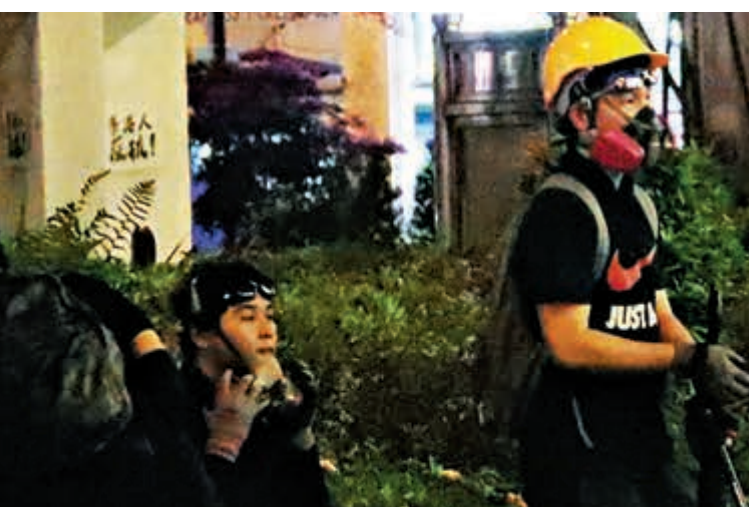
▲蒙面暴徒在搞事期間不敢以真面目見人，只有在休息之時才鬆懈露臉