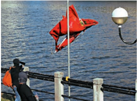
▲沙田侮辱國旗案被告判處社會服務令，社會一片嘩然認為是輕判