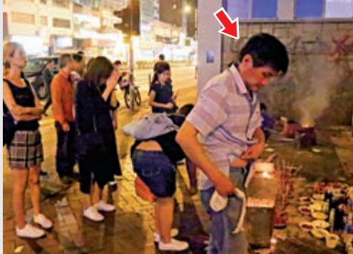
▲戲子做戲做全套，「拜祭」時祭品蠟燭樣樣齊