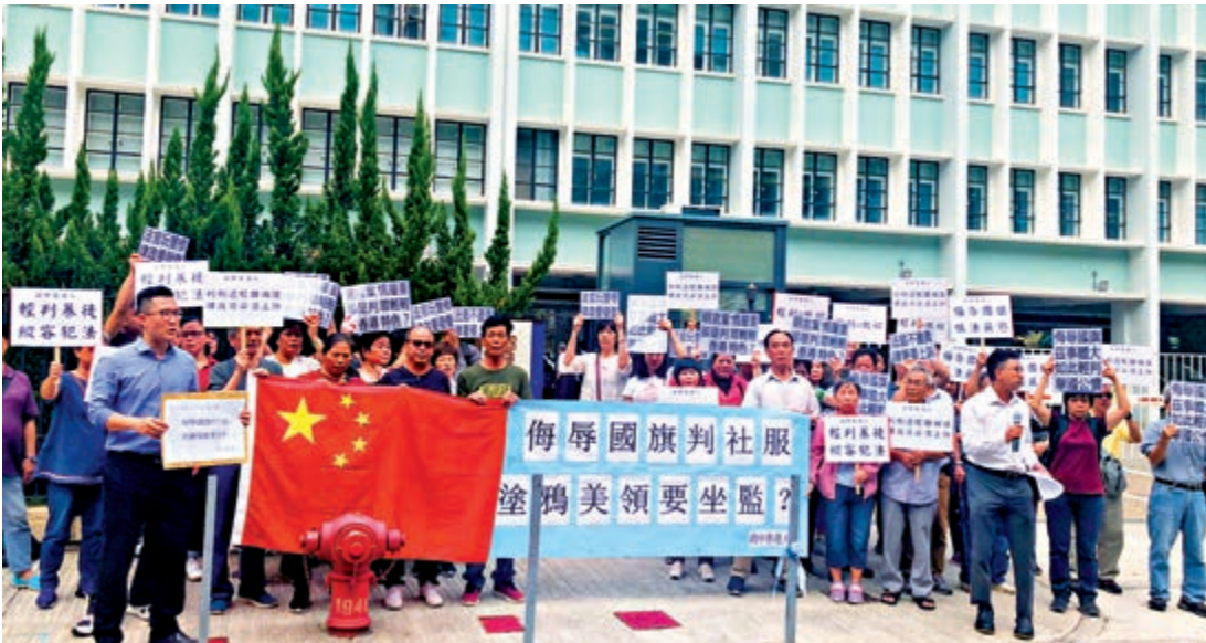
「政中香港人」逾50人請願，要求就「侮辱國旗罪」輕判社會服務令上訴