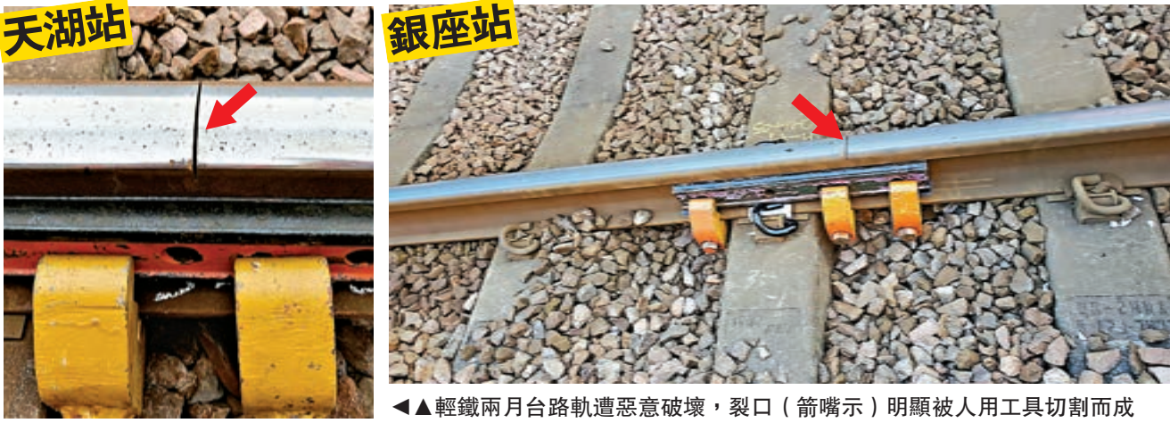
▲▲輕鐵兩月台路軌遭惡意破壞，裂口（箭嘴示）明顯被人用工具切割而成