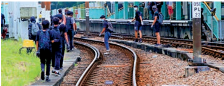
▲暴徒於十月中旬曾走入屯門輕鐵站路軌，毀壞站內多個設施，資料圖片

上一宗同類事件發生於上周五，一名休班港鐵人員通知工程團隊，在銀座站往天逸方向的一號月台近車頭位置，一段路軌上疑似有一條裂紋。工程人員到場後確認路軌有一切割痕跡，長約七厘米、闊度約兩毫米、深度約七毫米。該割痕的形狀及切口，亦明顯地是用工具造成。工程人員當時進行臨時加固，並在當晚收車後跟進。