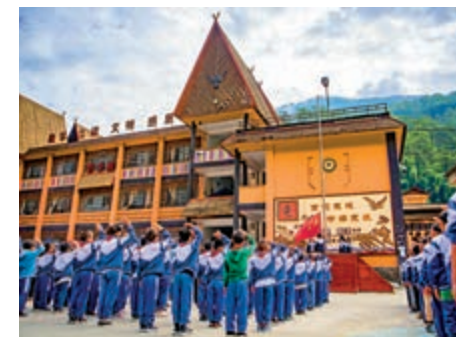
▲雲南獨龍江鄉中心學校舉行升國旗典禮

全會提出，要實行最嚴格的生態環境保護制度，全面建立資源高效利用制度，健全生態保護和修復制度，嚴明生態環境保護責任制度。