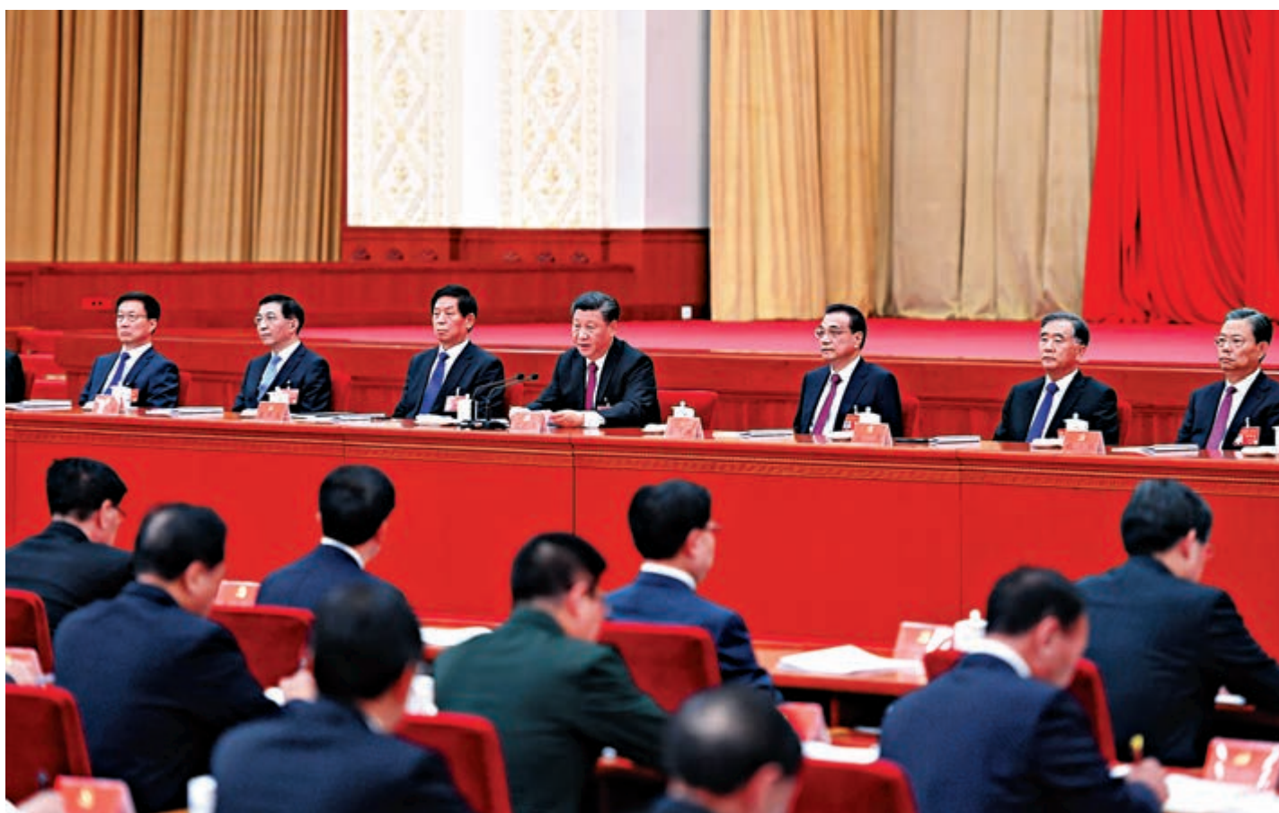
▲中國共產黨第十九屆中央委員會第四次全體會議，於2019年10月28日至31日在北京舉行。這是習近平、李克強、栗戰書、汪洋、王滬寧、趙樂際、韓正等在主席台上

馬偉明生於1960年4月6日，為中國科協副主席，中國人民解放軍海軍工程大學電力電子技術研究所所長。據中國科協官網介紹，馬偉明長期致力於電氣領域研究，帶領團隊在艦船綜合電力、電磁發射和新能源接入技術等領域取得系列具有革命性意義的原創性成果。2001年，41歲的馬偉明當選中國工程院最年輕的院士。2017年，中央軍委主席習近平簽署命令，馬偉明被授予「八一勳章」。