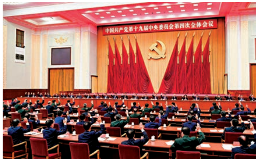
▲中國共產黨第十九屆中央委員會第四次全體會議，於2019年10月28日至31日在北京舉行。圖為中央政治局主持會議

【大公報訊】中國共產黨第十九屆中央委員會第四次全體會議，於2019年10月28日至31日在北京舉行。全會強調，堅持和完善中國特色社會主義制度、推進國家治理體系和治理能力現代化，是全黨的一項重大戰略任務。全會並提出了堅持和完善13個制度體系，包括堅持和完善社會主義基本經濟制度，推動經濟高質量發展；加快完善社會主義市場經濟體制，完善科技創新體制機制，建設更高水平開放型經濟新體制。