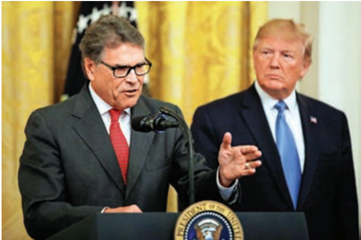
▲美國總統特朗普和能源部長佩里（前）資料圖片