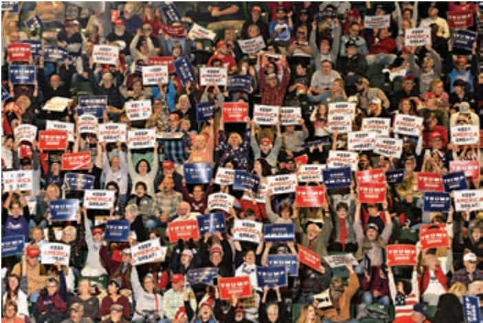
▲特朗普的支持者1日在密西西比州的造勢大會上高喊口號