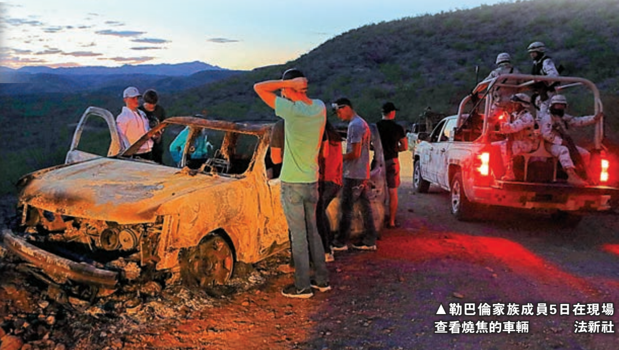
▲勒巴倫家族成員5日在現場查看燒焦的車輛

【大公報訊】綜合法新社、美聯社及BBC報道：當地時間4日，墨西哥販毒集團在該國北部伏擊了3輛越野車，導致3名婦女和6名兒童喪命。據悉，所有遇害者均來自美國知名摩門教家族「勒巴倫」(LeBaron)家族，事發時正驅車前往鄰近州。墨當局指，遇害者可能因被毒梟認成敵對幫派成員而誤殺。美國總統特朗普5日發布推文，呼籲墨國向販毒集團宣戰，並表示美國已準備好協助墨國清理「怪物」。