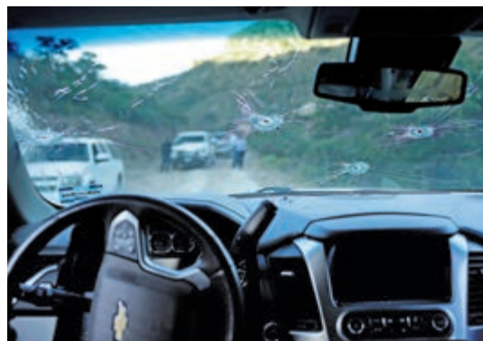
▲現場一輛汽車的擋風玻璃上滿是彈孔