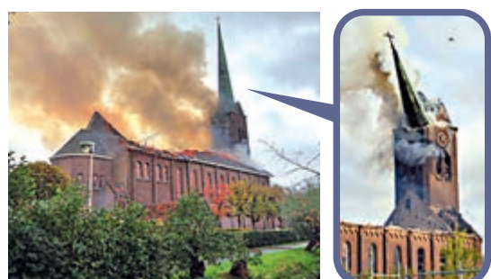
▲起火荷蘭教堂的標誌性尖塔被燒斷

發生火災的教堂位於南荷蘭省霍赫馬德，名為「Onze-Lieve-Vrouw-Geboorte」，原本正進行