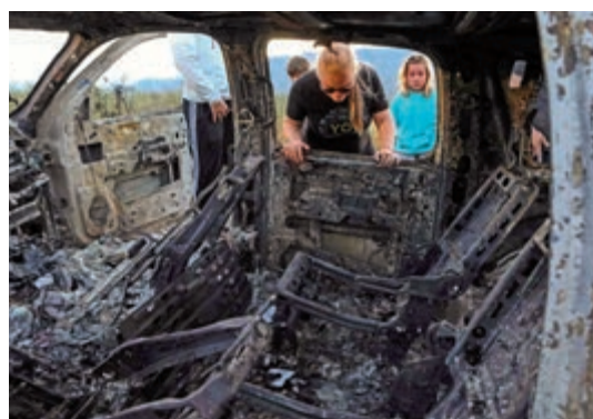
▲現場的一輛汽車內部已完全被燒焦

4日，槍手在索諾拉州和奇瓦瓦州之間的一條鄉村公路上實施了伏擊。事發當時，勒巴倫家族的3名婦女帶著14名兒童，分別駕駛3輛汽車前往機場。在車輛開到靠近美國邊界的莫拉農場地帶一帶時，伏擊的槍手先是開槍，接着放火燒毀車輛。據遇害者親屬及墨西哥官員說，3名婦女和6個孩子死亡，包括一對年僅8個月的雙胞胎。事件中有8個孩子設法逃生，其中5人受傷。