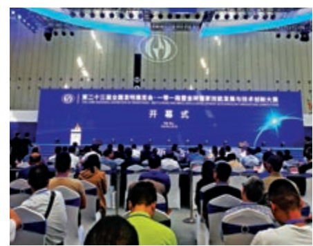
▲第二十三屆全國發明展覽會，一帶一路暨金磚國家技能發展與技術創新大賽7日在佛山開幕

今年是全国發明展覽會連續第三年落戶佛山，開幕式上，來自全國的13個項目簽約，助力佛山創新發展。