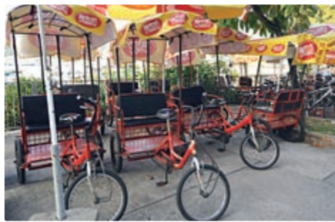
▲在長洲，單車是居民必備的交通工具