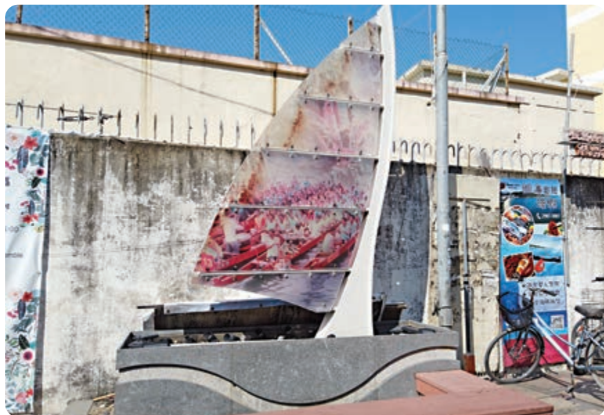
◀以風帆為裝飾品的擺設遍布長洲各個位置

傳統的長洲島民以捕魚為生，漁業曾經作為當地的主要經濟命脈，而由於捕魚業興旺，當地造船業及漁業製造業亦曾隨之而興起。到現時還有很多居民以此為生，所以在海邊見到很多船泊在旁，亦有不少人下鉤釣魚，更少不了是食新鮮海鮮的餐館。一到入夜，這些餐館更開始叫賣：「埋去坐！新鮮海鮮！」