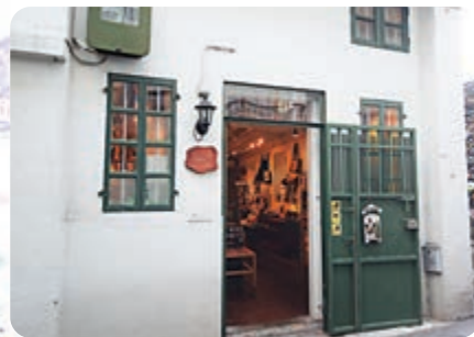
▲小店存在於舊建築物中