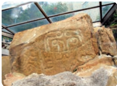
▲長洲石刻或與先民祭祀天氣和祈求風平浪靜有關

早在1970年，在長洲東南部曾發現了長洲石刻，人們推斷至少在3000年以前就已經有先民抵達長洲。與香港其他地方的史前石刻一樣，這塊石刻可能與先民祭祀天氣和祈求風平浪靜有關。