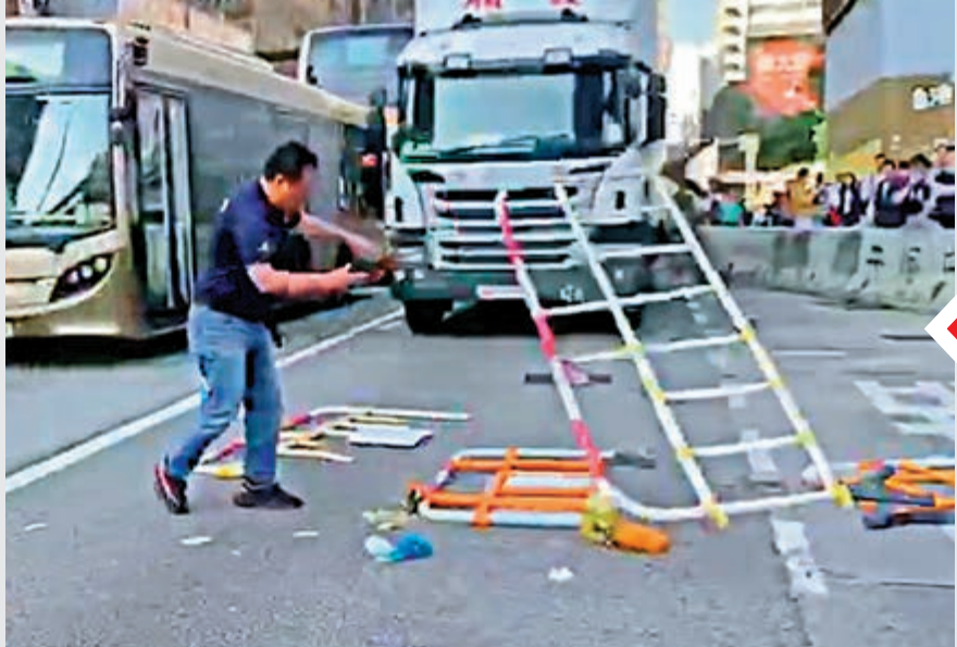
▲被毆司機無懼暴力，負傷忍痛繼續清理路障後駕車離開