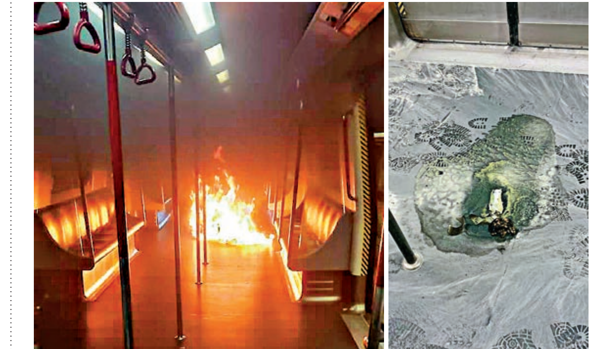
▲暴徒為阻交通不擇手段，竟在港鐵列車內擲燃燒彈（右圖）縱火