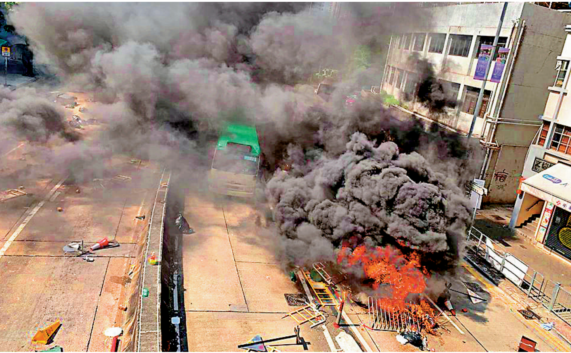
▲九龍新界多區主要道路昨早已嚴重擠塞，包括吐露港公路、屯門公路、東區走廊等。警方表示，只計上午，已有逾120宗破壞或堵路，20多個港鐵站關閉。

一度隨風蔓延至附近的坪石邨，附近往九龍灣方向一段馬路也有暴徒縱火，一架綠頂小巴被燒燬籠罩，場面有如災難電影。