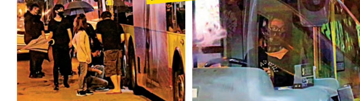
▲一群暴徒在油麻地嘗試攔截巴士