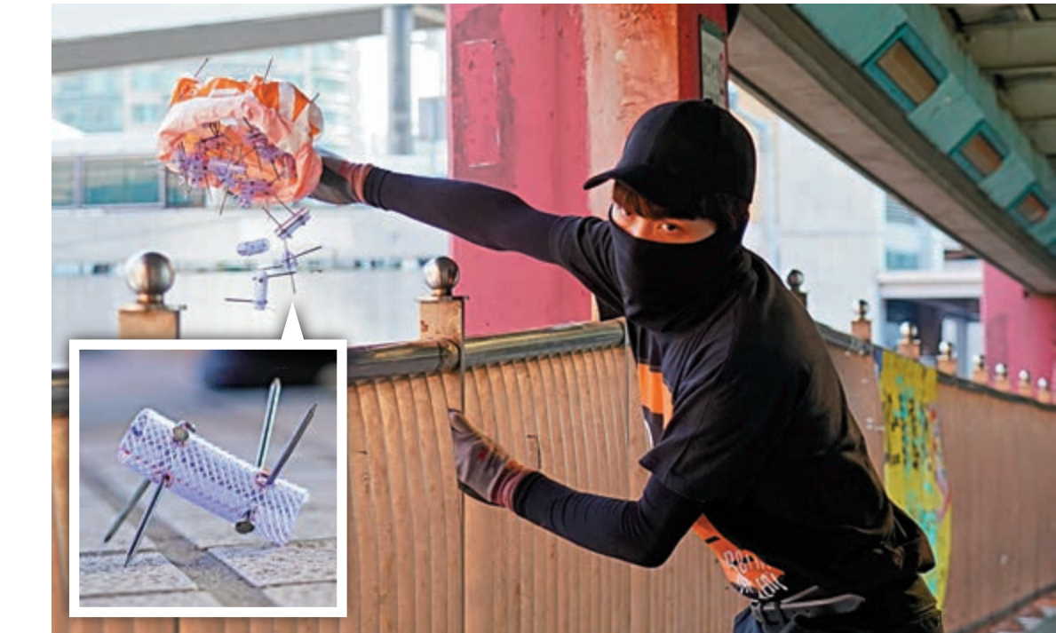
▲蒙面暴徒從天橋上向康莊道行車線拋擲自製刺釘