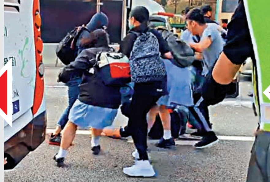
▲數名穿校服的女學生竟然協助暴徒圍毆貨車司機