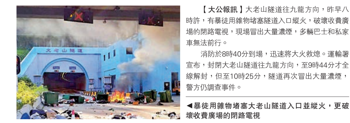
▲【大公報訊】大老山隧道往九龍方向，昨早八時許，有暴徒用雜物堵塞隧道入口縱火，破壞收費廣場的閉路電視，現場冒出大量濃煙，多輛巴士和私家車無法前行。