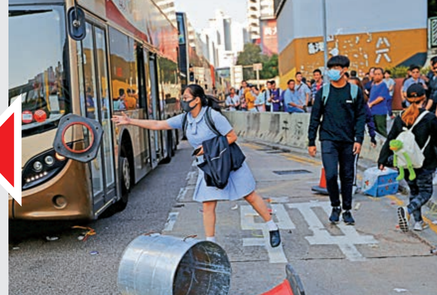
▲上班上學繁忙時間，有女學生不斷朝馬路扔雜物阻礙交通