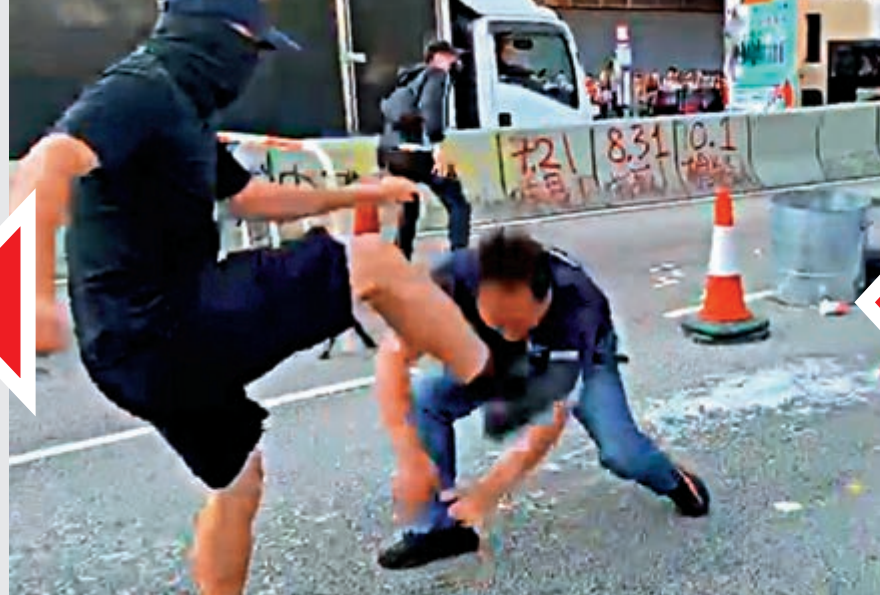
▲貨車司機慘被蒙面黑衣人毆打頭部