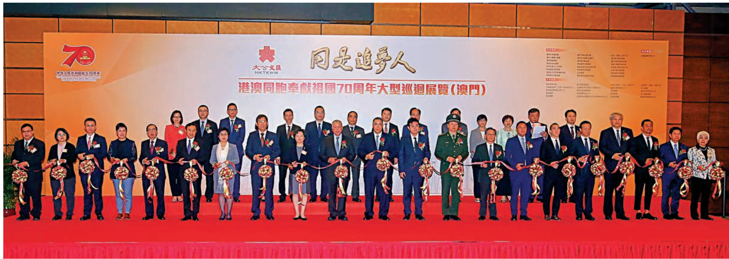
▲由香港大公文匯傳媒集團主辦的「同是追夢人——港澳同胞奉獻祖國70周年大型巡迴展覽」，13日在澳門旅遊塔會展中心揭幕