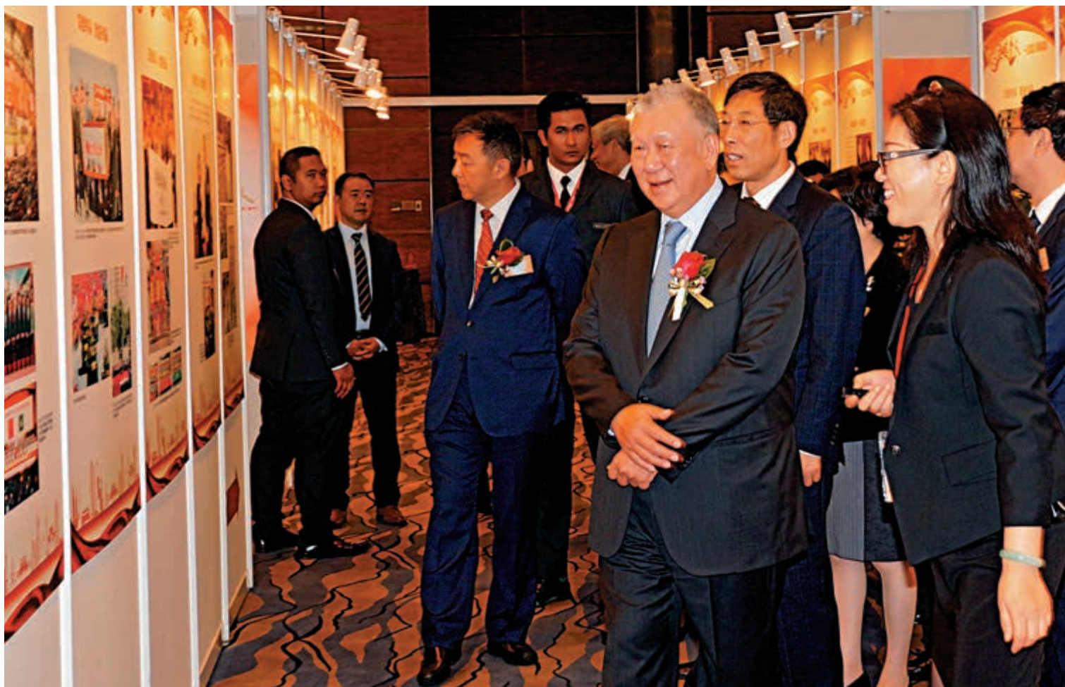
▲全國政協副主席何厚鏞等嘉賓觀看圖片展

姜在忠還表示，此次大文匯傳媒集團將展覽移師澳門舉行，希望通過權威翔實的圖文介紹，記錄家國崛起的曲折與奮進，挖掘鮮為人知的歷史往事，頌揚赤心報國的愛國情懷。他希望廣大澳門市民尤其是年輕一代，能從中釐清港澳與祖國榮辱與共的發展脈絡，體會兩地與祖國同根同生的緊密關係，明白安定祥和的社會環境的確來之不易，並由此珍惜與祖國和時代一起成長進步的機會，將小我融入大我，將人生理想融入國家和民族的偉大夢想之中，共同實踐並擔起中華復興的理想和重任。