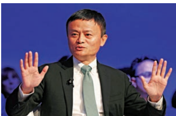
馬雲指出，在數據時代、在網際網路時代，每一分錢都極其之準確

【大公報訊】記者俞畫杭州報道：第五屆世界浙商大會13日在杭州開幕，來自全球各地的近2800名浙商代表與會，共同探討新形勢下民營企業怎麼解決存在和發展的問題。