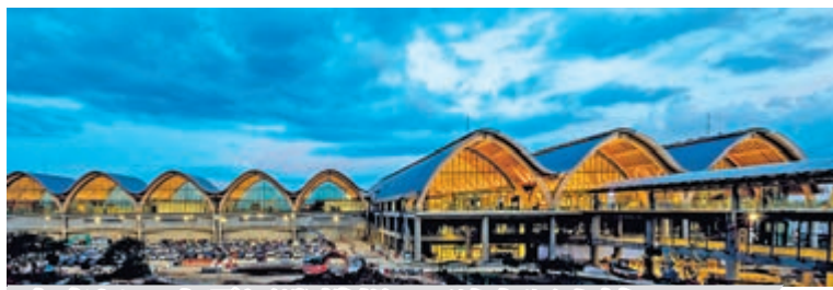
麥克坦—宿霧國際機場，2號客運大樓