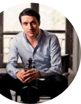
音樂節眾星雲集，包括柏林愛樂第一樂團首席本迪斯·巴格利

深具歷史氣息的亞洲協會香港中心上演，邀請中提琴家弗拉迪米爾·孟德爾遜、鋼琴家李嘉齡等多位海外及本地音樂家，以音樂配合古蹟活化的主題。除音樂會外，「樂·誼國際音樂節」亦會舉辦一連串社區及教育活動，包括由參與音樂節的藝術家主持的大師班，歡迎公眾人士和學生參與，詳情可參閱垂誼樂社官網(www.musicussociety.org)。