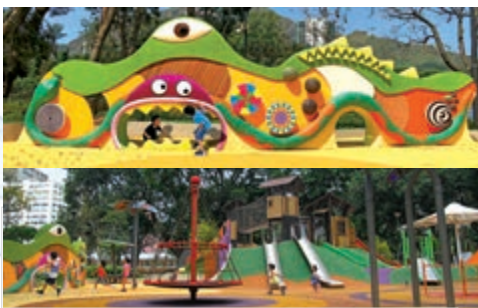
屯門公園共融遊樂場

評審團評語： 這是一個在複雜的地形中展示如何協調新舊、自然與人為之間關係的絕妙項目。它創造了各種令人愉悅的優質空間，無意間吸引你駐足欣賞，去感受日光，凝視樹木的陰影，享受風景。