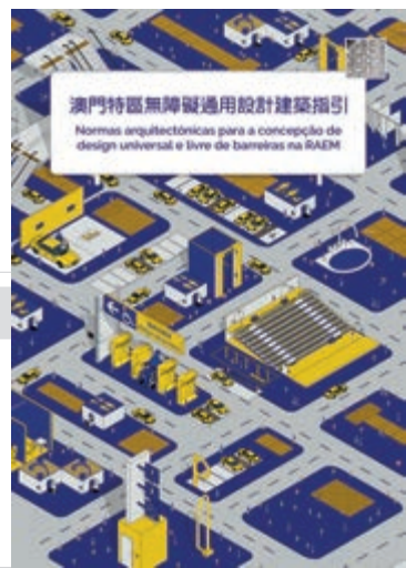
澳門無障礙通用設計規範指引

評審團評語： 菲律賓第二大機場擴建的建築設計考慮到文化和氣候變化的因素，絕妙的運用精緻的物料和形狀，連繫建築結構和服務。