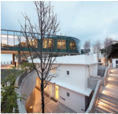
香港賽馬會芝加哥大學教育綜合大樓 芝加哥大學袁天凡、慧敏校園