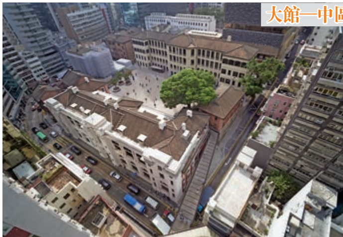
大館—中區警署建築群活化計劃

評審團評語： 這是一個私人發展商活化荃灣工業區的新模式。該項目的精髓不僅是將三家昔日的紡織廠重新改造成一個具有當代文化導向的商業建築群，而且通過創新、商業規劃和社區參與為紡織業注入新活力。