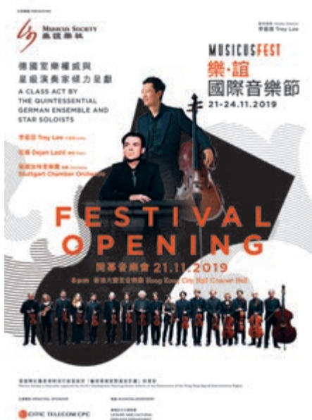
▲「2019樂·誼國際音樂節」開幕音樂會