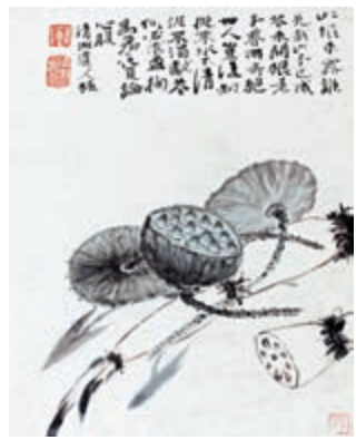
▲《花果圖》為石濤《花果冊》其中一幅代表作

逾千件明清廣東書畫以及嶺南畫派創始人的代表作，其中包括過百件高劍父的作品。已故收藏家利榮森捐贈的五千八百餘件「北山堂」藏品，包括倪瓚行書詩札、石濤《花果冊頁》、鄭板橋《竹石圖軸》等。