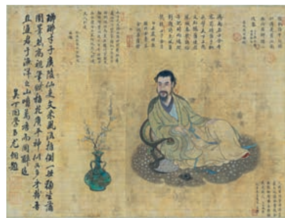
▲《王士禎賞梅賦詩圖》