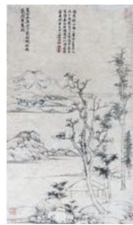
▲元代畫家陶鈺的傳世孤本《幽亭遠壑圖》