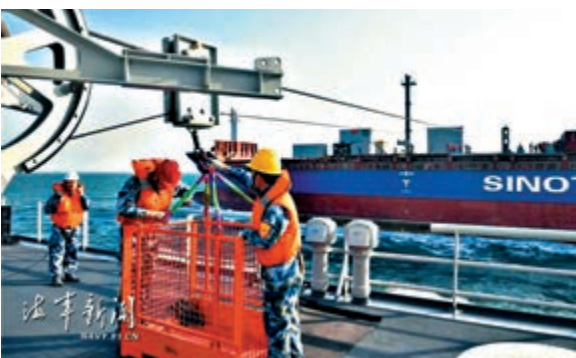
▲中國海軍近日首次應用民船加裝模塊化航行橫向補給系統，對水面艦艇實施海上補給

宋忠平分析，模塊化航行橫向補給系統在戰時可以直接安裝在民船上，讓民船充當中小型綜合補給艦，這種方式可以讓解放軍的補給能力成倍的增加。此次試驗成功說明，中國民船具備多種模塊化改裝能力，足以讓解放軍未來軍民融合補給能力大大提升。