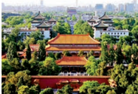
景山之巔南望中軸線

北京城中軸線歷史上的核心建築，是始於元「至元四年城（建都）京師」（元陶宗儀《輟耕錄》），明、清相沿六百四十五年（一二六七至一九一二年）的皇城；當今的核心建築，則是天安門廣場。這條中軸線相關區域，不但是歷史文化遺存，而且留下近代以來中華民族奮起抗爭的足跡、追求偉大復興的里程碑：一九〇〇年，「八國聯軍」炸毀正陽門、炮轟天安門、炸壞天安門前華表，中華民族遭遇空前災難；一九一一年辛亥革命，兩千年封建統治落幕，皇宮變成「故宮」；一九一九年五四運動，覺醒的現代中華兒女，在天安門前誓死打倒帝國主義、封建主義；一九三〇年起至抗日戰爭，實施《完整故宮保護方案》，從天安門到地安門，對中軸線核心區古建築群進行完整保護；一九三七年「盧溝橋事變」之後，「南苑抗戰」在中軸線南端打響，愛國將領佟麟閣、趙登禹率七千熱血青年，英勇抗擊日寇，壯烈殉國。