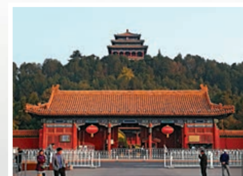
北京城中軸線上紫禁城後靠景山

天安門廣場平面布局，實際上延續了「左祖右社」。只不過如今的「左祖」，已不是封建時代家天下的祖先，而是中華民族輝煌燦爛歷史遺存，即國家博物館歷史文物，中心殿堂是「古代中國」；是中華民族近代百年追求偉大復興的革命文物，中心殿堂是「復興之路」。這個「右社」，則是人民當家作主的社會主義國家，中國古代「民為貴，社稷次之，君為輕」（《孟子·盡心章句下》）等「民本」思想，發展為現代民主。屹立在「左祖右社」之間的人民英雄，左肩擔負着民族昨天的歷史，右肩托起新中國人民民主制度。人民大會堂內部布局，中央是萬人大禮堂，周圍是各省廳，也借鑒了《周禮·考工記》「明堂」中央為「太室」、周圍為「少室」的規制