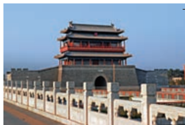
北京城中軸線南端永定門