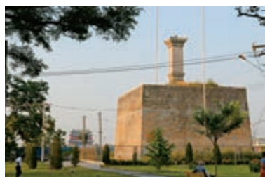
永定門前清乾隆《皇都篇》御碑