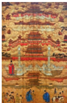
明嘉靖時期朱邦《明代北京宮殿圖》軸大英博物館藏

乾隆《御製詩餘集》卷二十，嘉慶三年（一七九八年）十一月九日《夜雪六韻》，於「十二重樓」下自註：「《十洲記》：『崑崙山一角有積金為天墉，城方千里，城上安金台五所、玉樓十二所。』《漢書·郊祀志》：『黃帝時為五城、十二樓，以候神人於執期（地名），名曰「迎年」。』是十二樓之數，雖出仙家，而黃帝時已有其制。考京師都城宮殿，成於永樂年間。其時，「機事皆決於姚廣孝」。按《明史》載：『廣孝通陰陽術數之學，營建規制自多與議。今京師宮殿、城門，仿古重檐台門之制者，中一路（中軸線），曰正陽門、天安門、端門、午門、太和門、太和殿、保和殿、乾清宮、坤寧宮、神武門、鼓樓、鐘樓，凡十有二。當時創建，不特借義《十洲記》所稱崑崙樓數，抑即仿黃帝時十二樓，以取迎年之義。是以明李時勉《北京賦》有云「損益乎黃帝合宮之宜也」。』