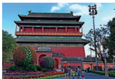
北京城鼓樓