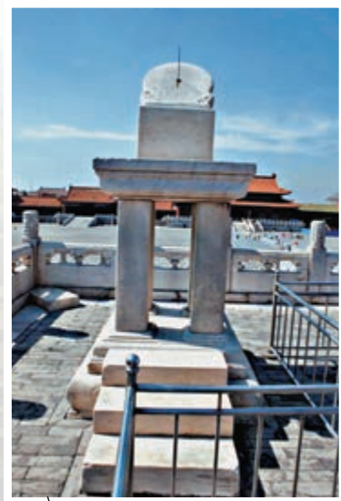
太和殿丹陛上傳統計時器日晷