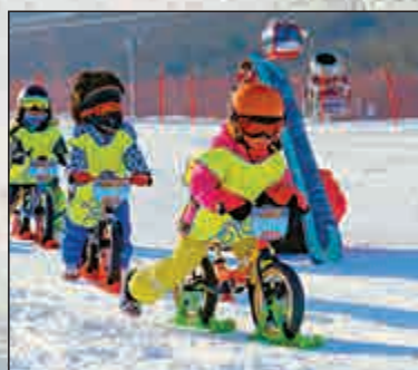
小朋友在體驗雪地平衡車

據介紹，吉林省將重點打造「冰雪絲綢之路」，推動廣泛的境內外交流合作，這也成為該省冰雪產業連接到瑞士、芬蘭、日韓的重要載體。