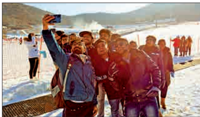
留學生第一次體驗滑雪，興奮不已