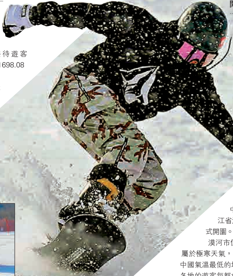
近日，東北多家雪場陸續「開板」迎客，吸引大量海內外遊客前來體驗