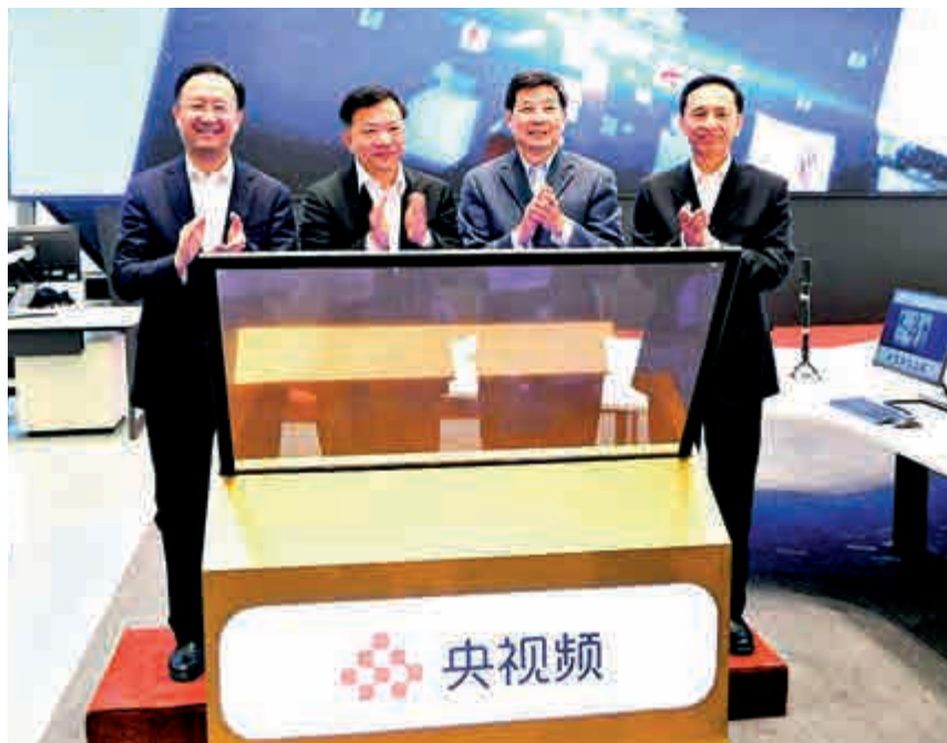
11月20日，中國首個國家級5G新媒體平台正式上線