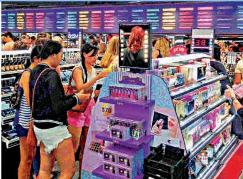
彩妝相關股份一覽