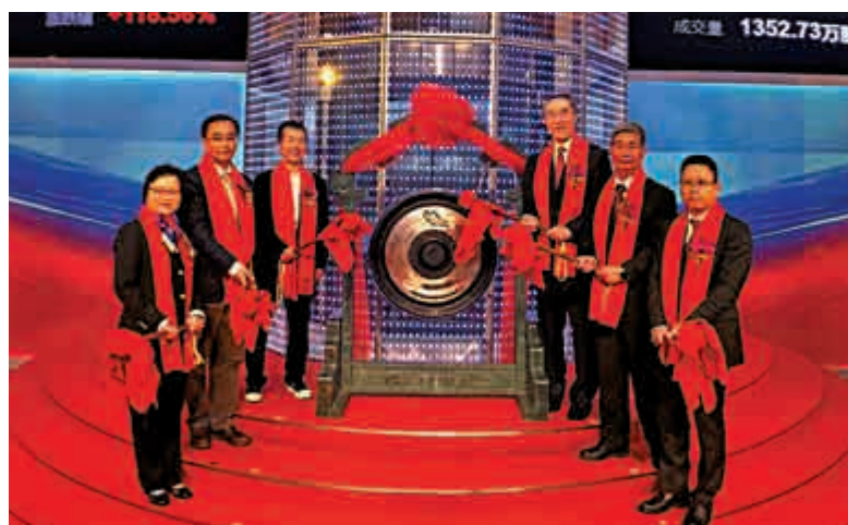
▲清溢光電董事長唐英年(左三)及唐英年(右三)主持上市敲鑼儀式