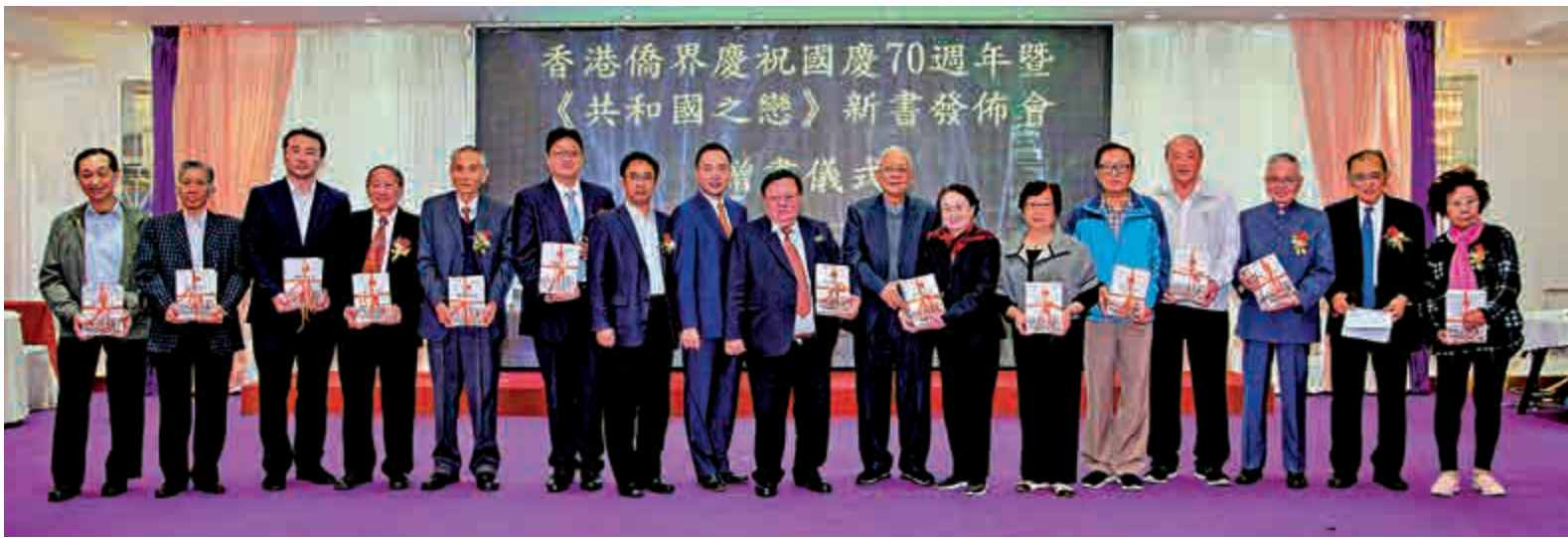
▲眾嘉賓於活動合照