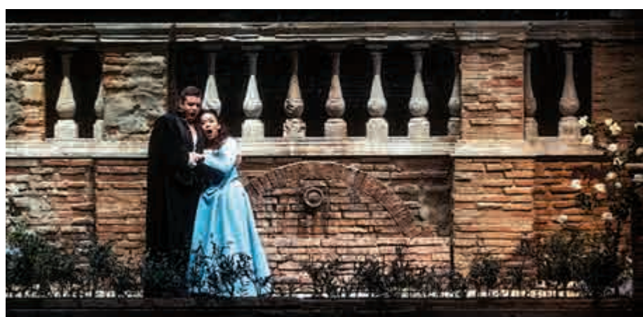
▲《弄臣》第一幕第二場的愛情二重唱場面