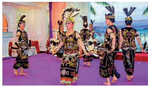
▲香港碧珍歌舞團演出印尼舞

他介紹，該書共設置愛國人生、赤子情懷、投資報國、改開先行、國貨傳奇、商業貿易、文學媒體、文藝攝影、體壇英傑、後繼有人等二十個欄目，將人物按欄目內容編撰在一起，形成僑領和廣大僑友共同