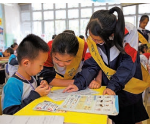
▲學生擔任服務大使，可以培養責任心和自律能力