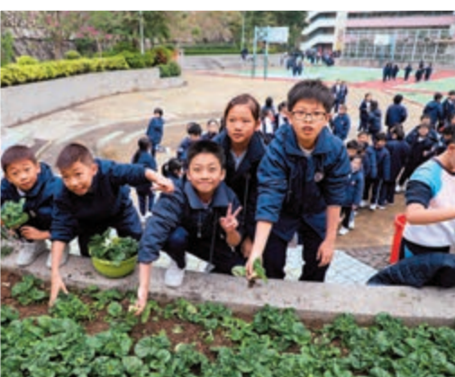
▲負責學校菜魚共生系統的學生，會被稱為菜魚大使