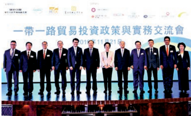
▲「一帶一路」貿易投資政策與實務交流會眾多嘉賓在會議現場合影留念

【大公報訊】11月21日，由中聯辦經濟貿易處發起、商務部會同中國國際貿易促進委員會、香港貿易發展局、香港中國企業協會共同主辦的「一帶一路」貿易投資政策與實務交流會在香港舉行。中國商務部副部長王炳南、香港中聯辦副主任仇鴻、香港特區政府商務及經濟發展局局長邱騰華、中國國際貿易促進委員會副會長陳建安、香港貿易發展局主席林建岳、香港中國企業協會會長高迎欣、香港中華總商會會長蔡冠深、香港工業總會主席葉中賢、香港中華出入口商會會長林龍安等嘉賓出席會議。