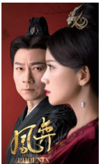
▲黎耀祥(左)在《鳳弈》中演太監