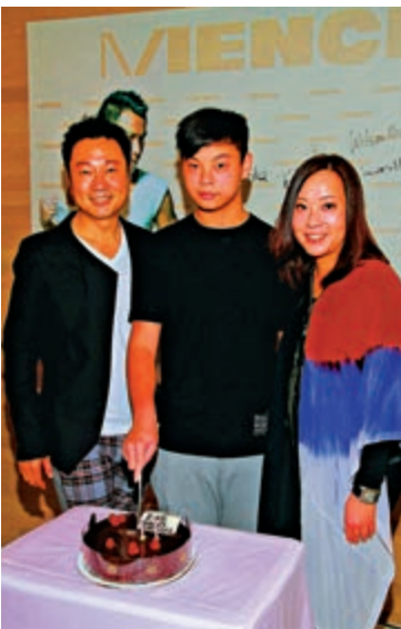
▲黎耀祥與妻兒合影