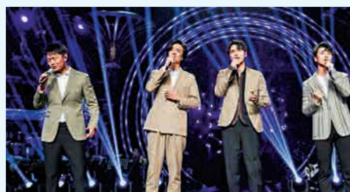
展歌喉 ◀《聲入人心》讓不少年輕歌手一資料圖片

比流行歌曲舞台內容更豐富的是，《聲入人心》除獨唱外，還有許多難度甚大的二重唱、三重唱和四重唱，令人陶醉在調性多變、旋律疊嶂、和聲豐富的立體聲中。演唱者各自有獨立聲部，彼此卻能默契配合，相輔相成。男高音可以用高亢的聲音來個「金雞獨立」，但他們具有團隊精神，重視整個曲目的協調、和諧，所以金色之聲也不會賣弄，不會炫技。二重唱《舒伯特小夜曲》《搖滾紅與黑》，三重唱《小河淌水》《你眼裏的藍》，四重唱《愛之書》《友誼地久天長》，等等，一首首唱得回腸蕩氣，連「出品人」（即評委和導師）也為之激動叫好。我幾乎聽遍了他們所唱的歌，有的還聽了多遍，也記住了他們大部分人的名字，我這裏