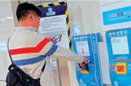
▲八達通單次消費交易上限大增

、屈臣氏、7 Eleven及萬寧等，每次交易金額亦可增至3000元，以滿足他們與日俱增的消費需要。