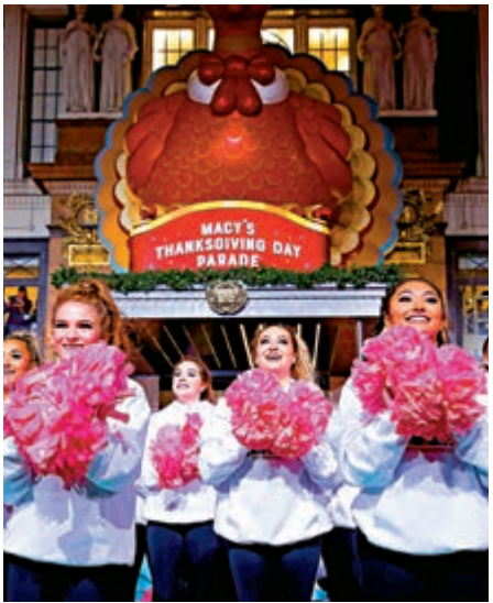
▲美國消費者對貿易關稅感到擔憂，但在假日季的總支出額仍然保持強勁

【大公報訊】記者張博睿報道：智能手機在美國感恩節假期旺季大派用場，業內估計，今年感恩節購物額有一半來自手機落單。截至美國東部時間周四下午5時，美國感恩節網上銷情頗佳，已較去年同期上升了20.2%，購物額有望超出44億美元的預期。此外，數字產品銷售方面，亞馬遜和沃爾瑪處領先地位。 上百萬的美國人選擇用智能手機在感恩節假期購物，網上訂單迎來大幅增長。