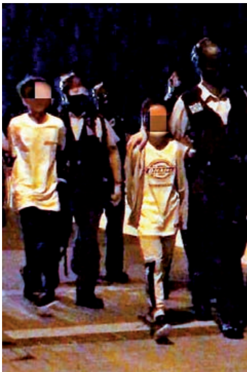
▲警方在馬鞍山海濱長廊拘捕涉嫌刑毀四間店舖的七男一女，年齡介乎12至17歲。