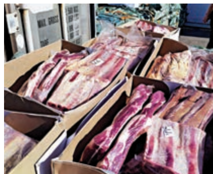
▲海關檢獲540公噸懷疑走私凍肉，市值約5000萬元

上表示，一個月多前發現有不法集團利用漁船走私凍肉，有組織及罪案及調查科作深入調查，前日聯同海口港地科採取果斷執法行動，於油麻地公眾卸貨區監視發現，有凍肉裝卸上四艘漁船後往香港東南面方向，意圖走私往大陸方向，人員隨即在海上截查該批漁船，檢獲540公噸懷疑走私凍肉。李續指，由於漁船上沒有冷凍設備，而凍肉分布在船上多個角落，大部分凍肉屬牛肉，有一定食用風險。目前案件仍在調查中，不排除有其他人被捕。