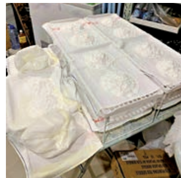
▲警方今年七月曾搗破「港獨」組織武器庫檢獲TATP。圖為當日現場檢獲的爆炸粉末