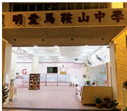
▲明愛馬鞍山中學日前宣布停課，以作深度清潔