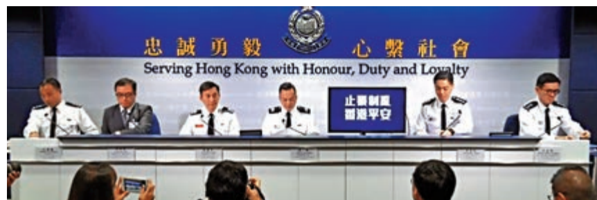
▲警察昨日在記者會上表示，被捕人士逐漸年輕化，罪行愈來愈重，情況令人擔憂。視頻截圖

呼自己名字，在場圍觀拍攝的街坊起哄，更詢問其他被捕青年的名字，試圖干擾警方執法。有市民在網上留言問：「犯罪年齡介乎12歲至17歲，他們的父母在做什麼？」亦有網民斥責，「犯法就係犯法，無分年紀。」