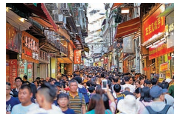
▲今年國慶期間，遊客在澳門大三巴牌坊前地手街遊覽。資料圖片

此前，珠海市橫琴新區工商部門已通過橫琴消協建立並不斷完善與澳門消委會合作跨境消費維權網絡調解與仲裁機制。目前，已實現消費投訴的網上受理、轉辦和在線處理，累計成功辦理澳門消委會轉來的消費投訴23件，為澳門消費者挽回經濟損失600餘萬元人民幣。