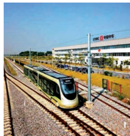
▲佛山高明氫能源有軌電車

因為氫能源有軌電車的研發，中車青島四方機車車輛股份有限公司獲得2019年國際氫能學會大獎——「威廉·格羅夫爵士」獎，這是全球軌道交通裝備企業首次獲得該獎，意味着該項目採用的氫能源有軌電車技術在全球居於領先地位。