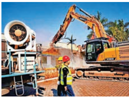
▲皇崗口岸重建啓動

深圳市福田區政府部門透露，力爭2020年上半年完成全部拆遷安置，2022年底前完成新口岸建設，為深港科技創新合作區和粵港澳大灣區建設提供保障。