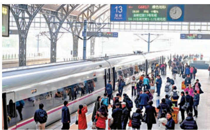
▲漢十高鐵路首發車G6817列車等待開行

連接「武漢城市圈」與「襄陽十城市群」的武漢至十堰高速鐵路（下稱，漢十高鐵路）29日通車運營，結