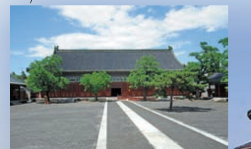
先農壇太歲殿，是壇內最大單體建築