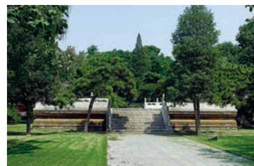
先農壇親耕台