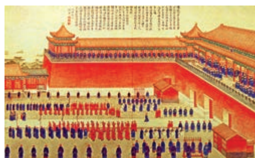
道光《平定回疆戰圖》冊之「午門獻俘」

皇穹宇是單層圓亭式建築，與祈年殿構造原理相同。只有一層的單簷，表示最高規格天數一。庭中澄泥青磚磨磚對縫砌成的垣牆，有回音壁