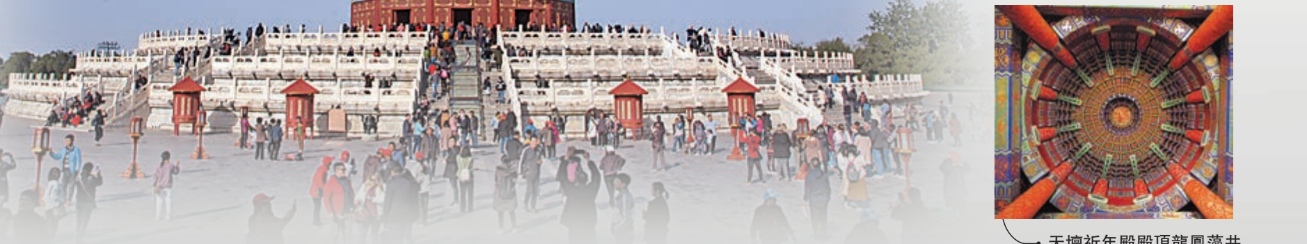
天壇祈年殿殿頂龍鳳藻井