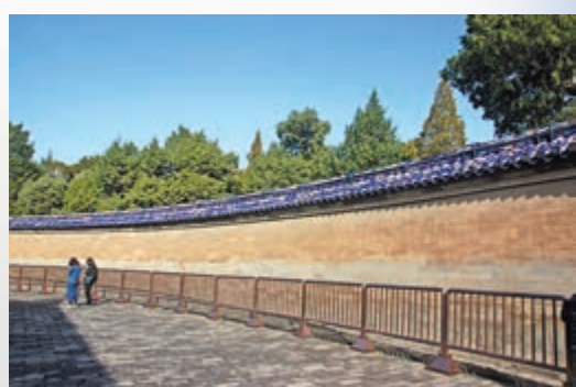
天壇皇穹宇鑲垣回音壁一段