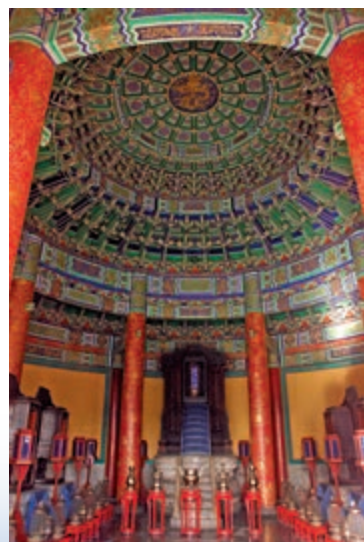
天壇皇穹宇殿內「皇上帝」神牌