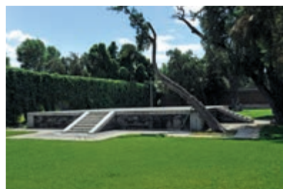
先農壇祭壇