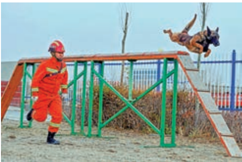
▲包頭市消防救援支隊訓練員在對搜救犬進行翻越障礙訓練。資料圖片