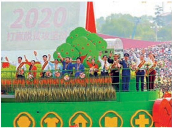
▲10月1日上午，慶祝中華人民共和國成立70周年大會在天安門廣場隆重舉行。這是群眾遊行中的「脫貧攻堅」方陣。

文章指出，中國特色社會主義國家制度和法律制度是被實踐證明了的科學制度體系，具有顯著優勢。中國特色社會主義國家制度和法律制度，植根於中