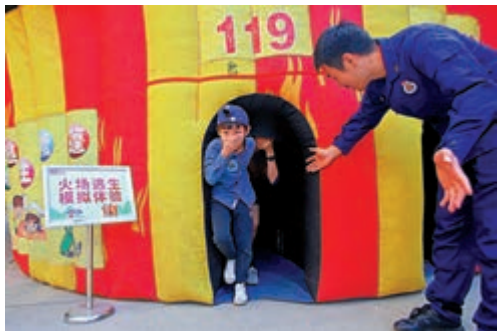
▲11月24日，在廈門市消防救援支隊特勤大隊，小朋友在消防隊員的指導下體驗火場逃生。資料圖片

習近平指出，應急管理部門全年365天、每天24小時都應急值守，隨時可能面對極端情況和生死考驗。應急救援隊伍全體指戰員要做到對黨忠誠、紀律嚴明、赴湯蹈火、竭誠為民，成為黨和人民信得過的力量。應急管理具有高負荷、高壓力、高風險的特點，應急救援隊伍奉獻很多、犧牲很大，各方面要關心支持這支隊伍，提升職業榮譽感和吸引力。