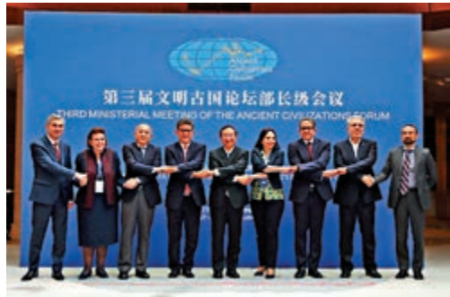
▲參加會議的部長合影。

中國文化和旅游部部長雒樹剛做主旨發言時表示，文明古國論壇自2017年成立以來，國際影響力不斷增強，在國際社會自信地發出了古國聲音，奏響了文明對話新樂章。中國政府高度重視文化在推進國家現代化進程中的獨特作用。唯有保護好、傳承好、發展好我們的優秀傳統文化，文明古國才能在新時代煥發新光彩，為本國乃至全球發展提供精神支撐。