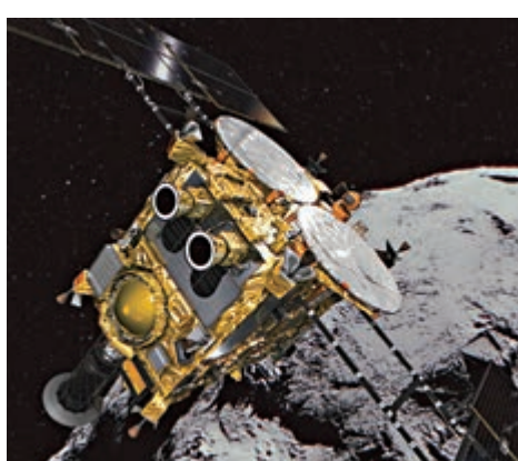
▲隼鳥2號預料1年後到達地球附近 網絡圖片