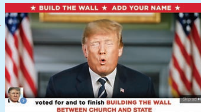
▲特朗普在YouTube投放的競選廣告

【大公報訊】綜合CBS及路透社報道：美國2020年大選將至，網絡平台上的政治廣告近期成為熱議話題。自10月起各大社交媒體紛紛做出回應：推特決定禁止所有政治宣傳廣告，谷歌及其旗下的YouTube近期也調整公司政策，撤下300多條特朗普的競選廣告，但臉書仍拒絕跟進。