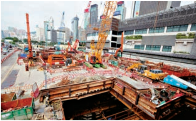
▲政府估計沙中線「紅磡至金鐘段」延至2022年第一季才能通車，較原定延遲了一季

【大公報訊】暴亂連累新鐵路線延誤通車。東鐵線是遭暴徒破壞的重災區，包括沙中線南北走廊的新信號系統，港鐵表示佔總長度一半的管線需要更換，政府估計「紅磡至金鐘段」延至2022年第一季通車，較原定2021年底延遲了一季。至於「屯馬線一期」預計於明年第一季開通，運輸署宣布加開三條接駁巴士或小巴線。