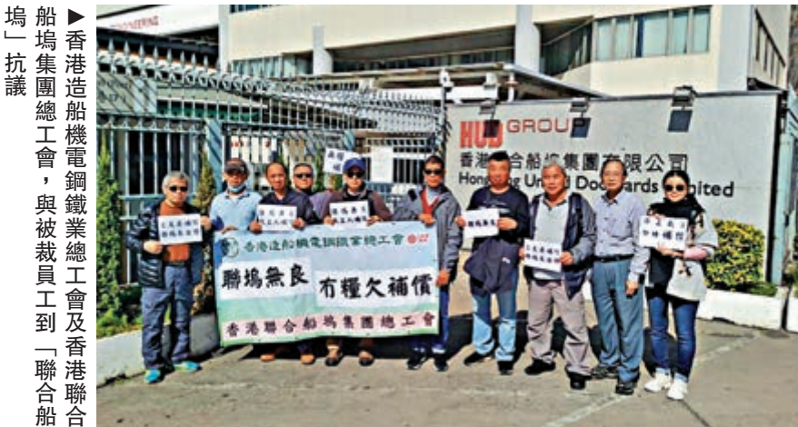
船塢員工抗議 聯合船塢集團總裁工會，與被裁員工到「聯合船塢」抗議