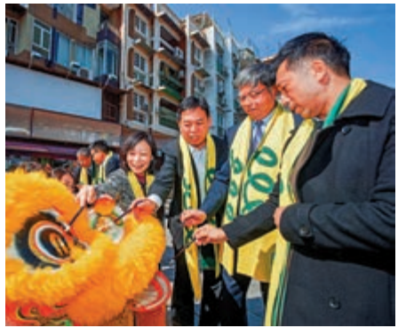
▲澳門文化局4日在大三巴牌坊舉行拜神儀式，以祈慶祝回歸20周年幻彩巡遊圓滿順利

過「2019年維吾爾人權政策法案」，這是對中國內政的又一次粗暴干涉。對此我們表示強烈憤慨，堅決反對。包括澳門同胞在內的全體中國人誓將團結一心，頑強鬥