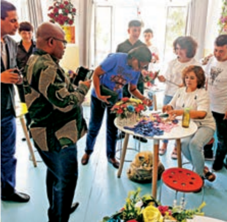
▲多國駐日內瓦外交官參訪團在新疆喀什職訓中心觀看學員插花

聲明指出，新疆是中國反恐、去極端化鬥爭的主戰場。新疆依法設立職業技能教育培訓中心並開展相關工作，着力消除恐怖主義、宗教極端主義滋生蔓延的土壤和條件，有效遏制了恐怖活動多發頻發勢頭，最大限度保障了各族民眾的生命權、健康權、發展權等基本權利。