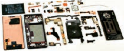
▲華為MATE 30手機中已無美零件