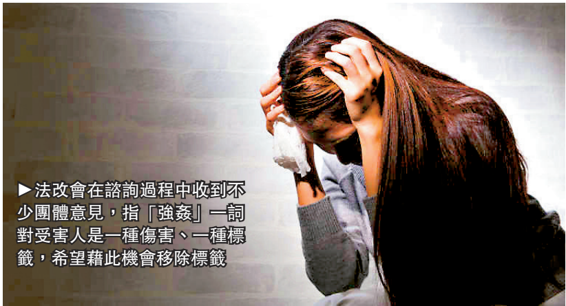
▶法改會在諮詢過程中收到不少團體意見，指「強姦」一詞對受害人是一種傷害、一種標籤，希望藉此機會移除標籤