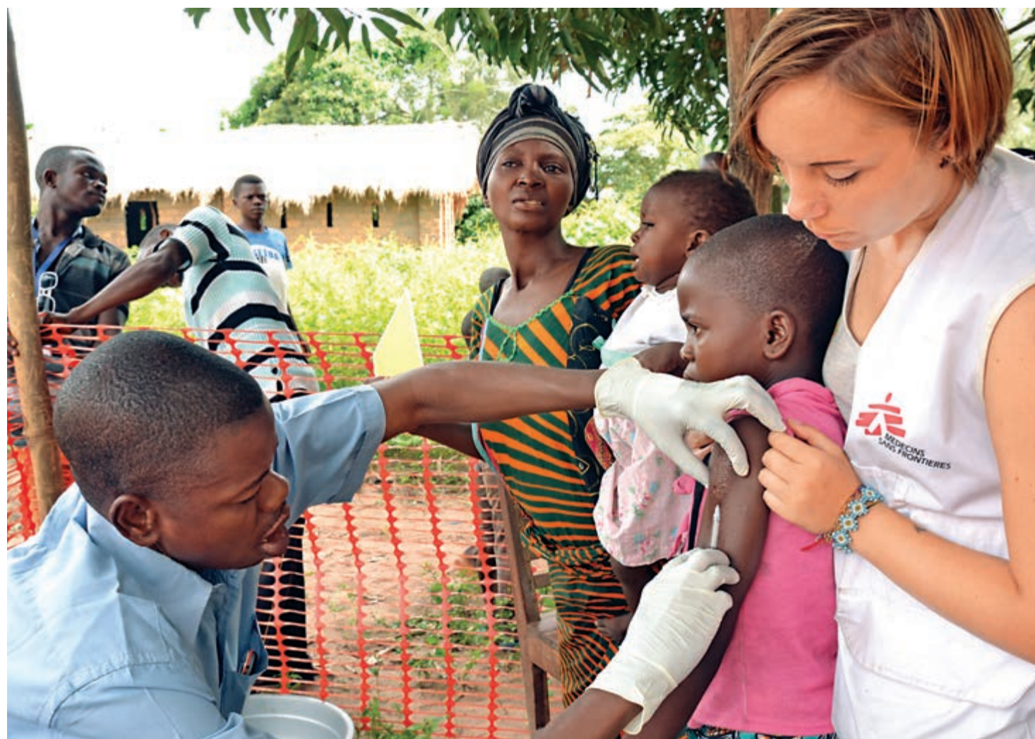
▲貧困國家及地區疫苗接種率較低，受麻疹影響更嚴重