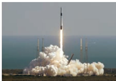
▲「獵鷹9」火箭升空，將「龍」飛船送往太空

「機器人旅館」，未來將由宇航員安裝在空間站外，可為一些重要的機器人工具提供保護。據美國航天局介紹，首批「入住