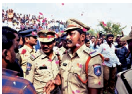
▲印度警察6日擊斃強姦犯後，受到群眾的熱烈歡迎

語言描述自己的心情，我感到開心，也感到悲傷，因為我的女兒永遠不會回家。我女兒的靈魂現在可以平靜了……我從沒想過我們能得到正義。」受害人的姐姐則表