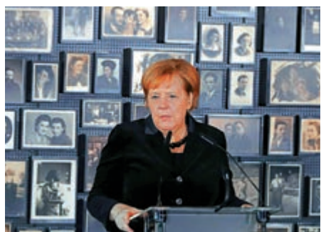
▲德國總理默克爾首次訪問奧斯威辛集中營

現年65歲的默克爾，由莫拉維茨基和一名集中營幸存者陪同，在曾有數千囚犯被槍殺的「死亡牆」旁默哀一分鐘，又到附近的比克瑙營地敬獻花圈。據報道，共有約100萬猶太人，以及10萬非猶太波蘭人、蘇聯戰俘及反納粹戰士，在奧斯威辛一比克瑙被殺害。