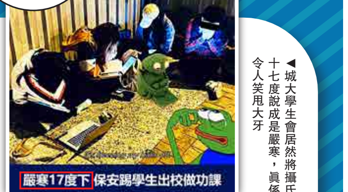
▲城大學生會居然將攝氏十七度說成是嚴寒，真係令人笑用大牙 嚴寒17度下 保安踢學生出校做功課