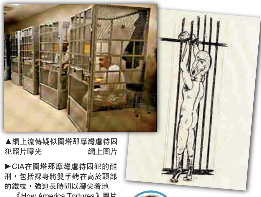
▲網上流傳疑似關塔那摩灣虐待囚犯照片曝光 ►CIA在關塔那摩灣虐待囚犯的酷刑，包括裸身將雙手銬在高於頭部的鐵枝，強迫長時間以腳尖着地

「黑牢」內有一招因人而異的壓力姿態。祖貝達聲稱，當時腿部傷勢未愈，但被迫赤裸站着，雙手被銬在高於頭部的鐵枝上，長時間以腳尖着地。此外，祖貝達曾經裸身站着，雙手被綁，一名臉部塗黑的男子用某種東西圍着他的脖子，將他的後腦撞向牆壁。另外，酷刑招數還有屈身上銬、大小禁閉箱、剝奪睡眠等。CIA拒絕回應傳媒查詢。另外，網上近日流傳疑似關塔那摩灣虐待囚犯的照片曝光。市民在網上的留言一面倒要求泛暴派和暴徒譴責美國：「叫香港啲泛民同黑衣暴徒去譴責美國啦，人權自由，法治嚟嗎」；「美國人雙重標準又一證明；泛民，你咁個主人違反人權啊，你咁點算啊？」還有人直指：「美國通過咗『關塔那摩灣人權法案』未？點解世界警察唔立法？」唔使鄭嘍講，答案大家都懂的。