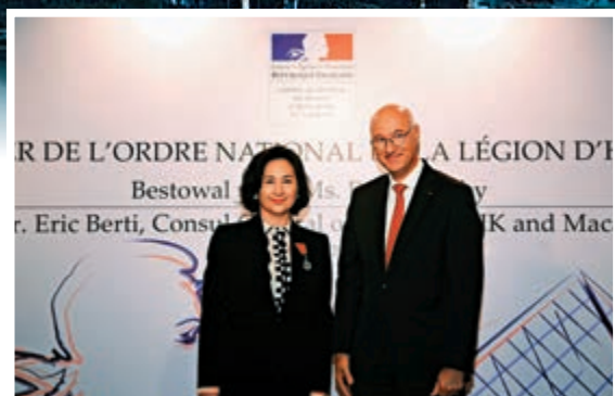
▲2018年，何超瓊榮獲法國政府頒發法國榮譽軍團騎士勳章

情，比如家務和我們的容貌。我認為這雖然給予我們更大的壓力，我們要花很多時間，才能面面俱到，但其實這也是一種鍛煉吧。我們應該從另外一個角度去看。」何超瓊說。她希望有越來越多的女性可以找到兩者之間的平衡。