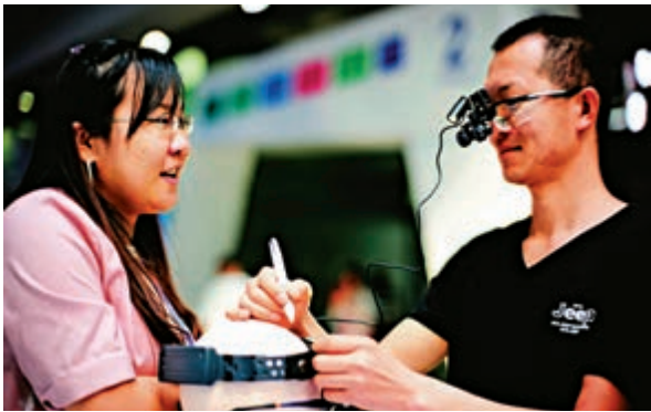
▲今年深圳高交會上，不少初創企業攜高科技產品亮相 資料圖片

本次活動以「創新創業、產業對接」為主題，聚焦人工智能、金融科技、生物醫療等領域的最新技術、產品和應用，由中國外交部南南合作促進會、湖南省科技廳指導，岳麓山國家大學科技城推進委員會、全球初創企業獎（GSA）組委會主辦。