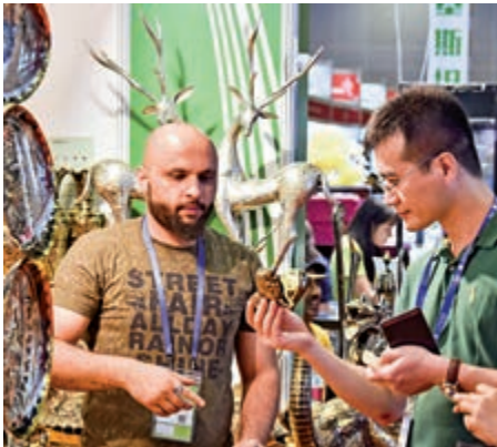
▲「一帶一路」等新興市場潛力巨大，消費者在廣西南寧東博會上選購巴基斯坦青銅器 資料圖片

他表示，目前WTO共有15個已提起上訴的在審案件，除已經召開聽證會的4個案件外，其餘11個案件均無法完成上訴