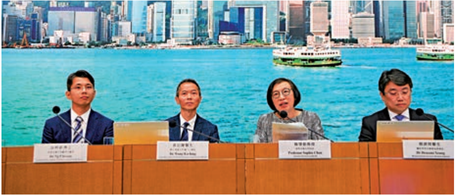
▲陳肇始（右二）呼籲市民盡早接種流感疫苗