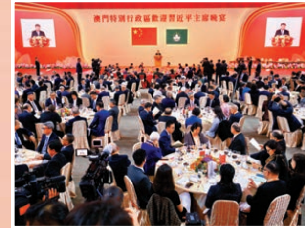
▲歡迎晚宴在澳門東亞運動會體育館宴會廳舉行