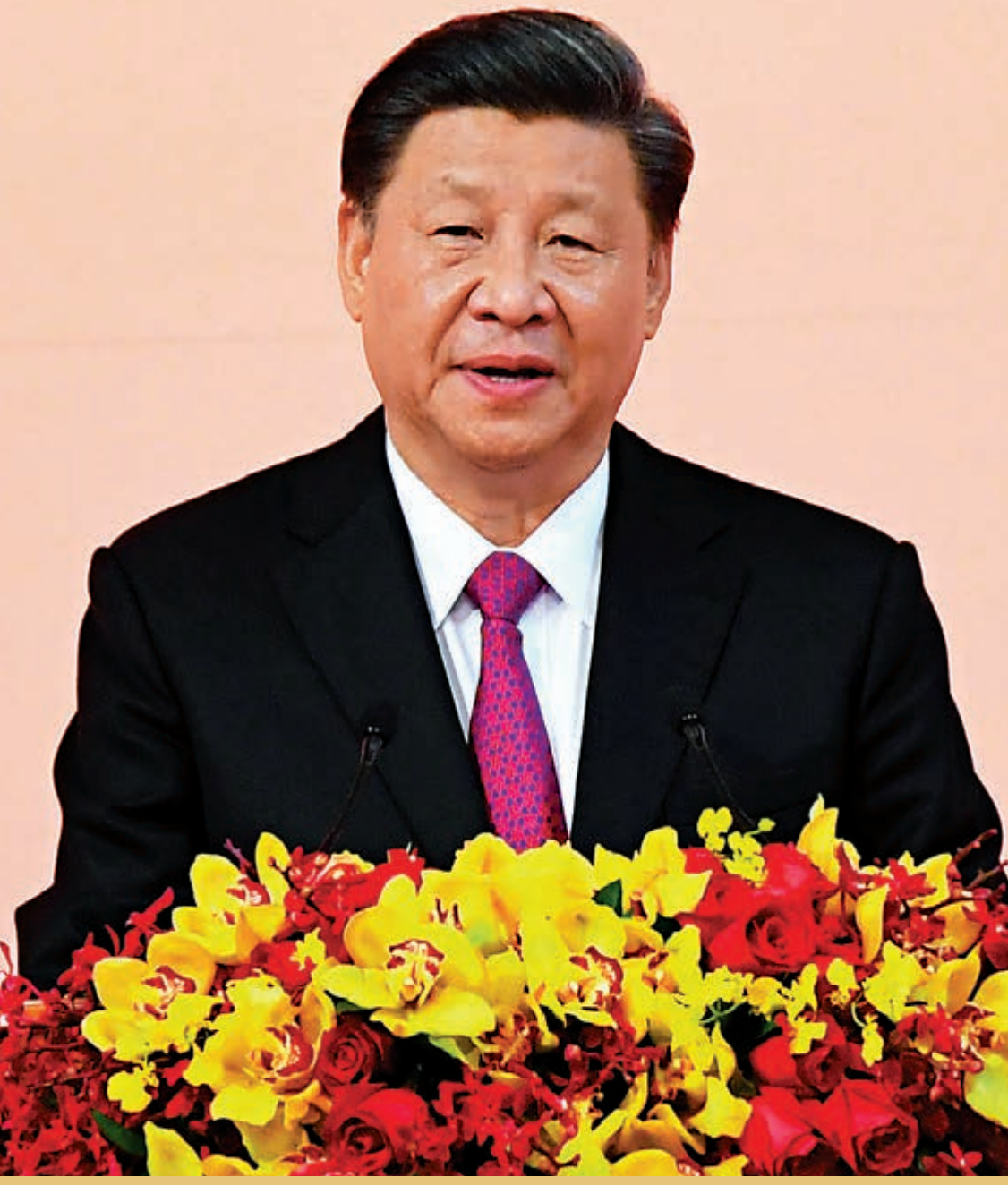
▶國家主席習近平19日晚出席澳門特區政府歡迎晚宴並發表重要講話