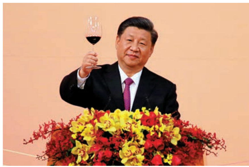
▶習近平主席舉杯出席歡迎晚宴的喜慶共賀澳門回歸20周年

同胞們、朋友們！ 今年是新中國成立70周年。70年來，在中國共產黨領導下，經過全國各族人民奮發圖強、艱苦奮鬥，我國