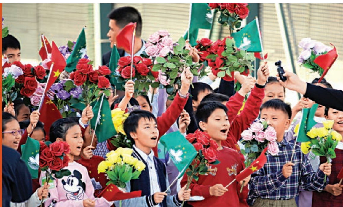
18日澳門兒童手持國旗及區旗歡迎習近平主席

葡萄牙《新聞日報》報道稱，經過平穩的政治過渡，澳門目前已經成為經濟發展和繁榮的成功典範。報道還指，澳門即將迎來新任行政長官賀一誠；賀一誠曾表示，希望澳門能夠成為連接中葡兩國的橋樑。