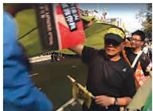
▲有民眾發現「罷韓」遊行布條下面根本沒有人 ▲21日高雄有團體發起「罷韓」遊行 資料圖片