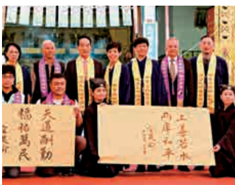
▲親民黨主席宋楚瑜盼兩岸和平

【大公報訊】據中通社報導：台灣2020年大選親民黨候選人宋楚瑜22日到苗栗通霄玉清聖殿，出席中華道教聯合總會祝嘏大典，獲總會贈「御印」、「御筆」祝福，宋楚瑜即席揮毫「天道酬勤、福祐萬民」、「上善若水、兩岸和平」16個大字，他向神明宣誓若當選，會將兩岸和平做好、照顧人民。