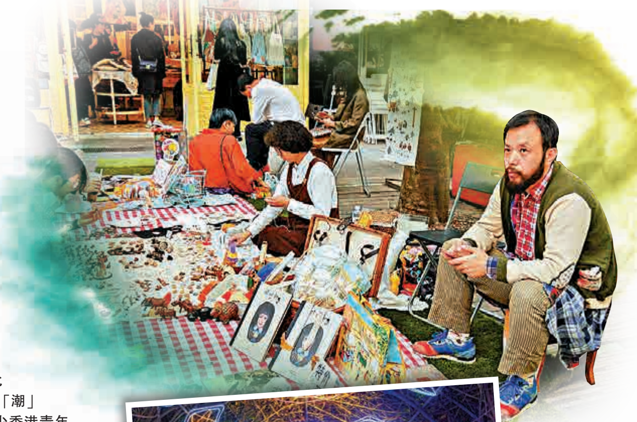
▲逛周末市集已成為香港年輕人熱衷到深圳遊玩的新選擇，可以邊尋寶，邊品嚐手工美食。圖為華僑城創意文化園市集一角