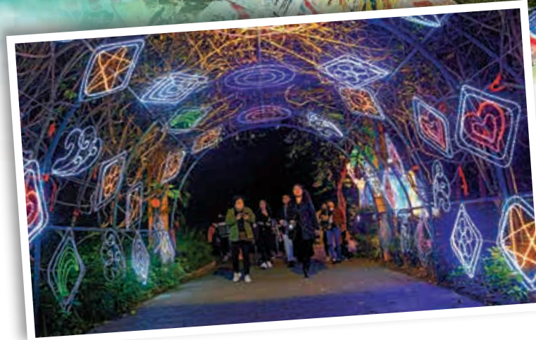
▲深圳錦繡中華民俗村今年推出的自貢燈會嘉年華，把新春傳統「科幻化」