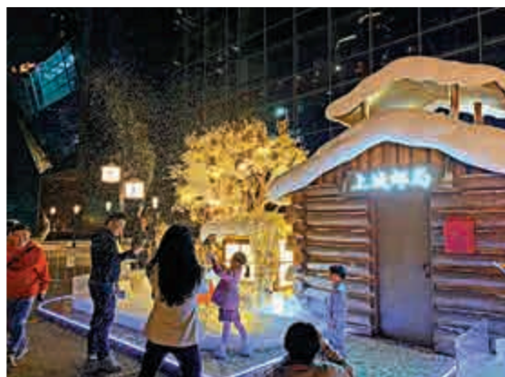
▲深業上城購物中心的雪景裝飾，最啱一家大小前來「打卡」