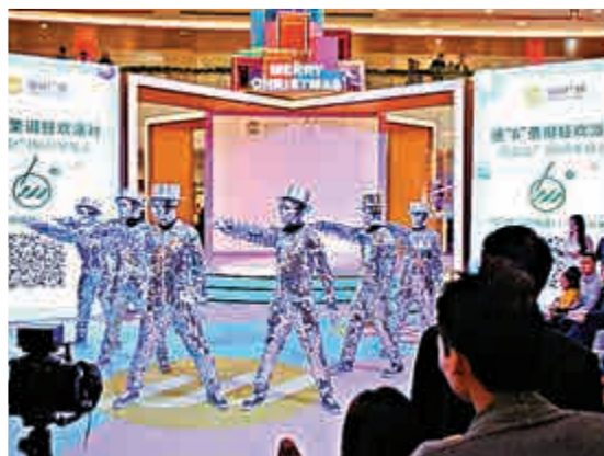
▲商場的聖誕狂歡派對有很多表演，吸引不少港人往觀賞消費