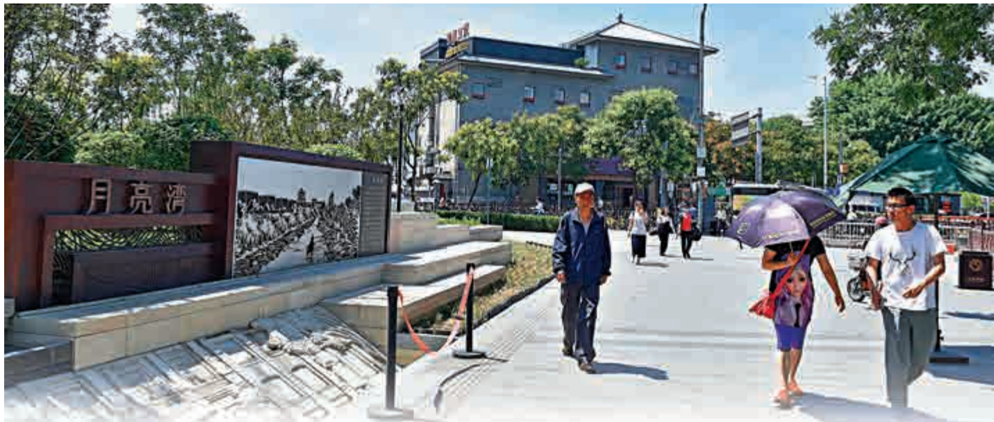
▲規劃提出，嚴格落實「老城不能再拆」，堅持「保」字當頭。圖為市民在北京市西城區的一處微公園「月亮灣」散步

此外，營造特色景觀視廊，圍繞看城市、看山水、看歷史、看風景主題，保護景山萬春亭、北海白塔、天壇祈年殿等地標建築之間的36條景觀視廊。