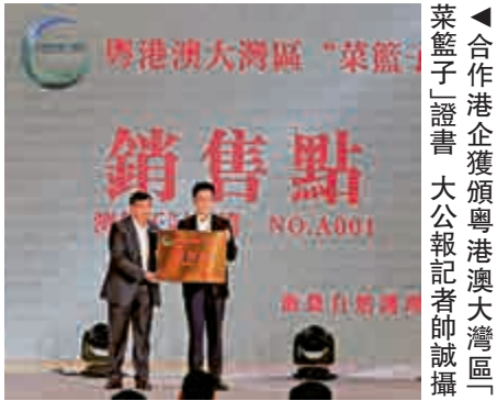
▲合作港企獲頒粵港澳大灣區「菜籃子」證書

30日，農業農村部副部長于康震在國新辦發布會上表示，元旦春節期間，不管是豬肉還是它的替代品，市場供應總體充足，價格也會總體穩定。