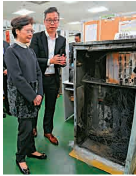
▲林鄭月娥到訪機電工程署和運輸署，了解該兩個部門為應對近月示威和破壞行為所採取的措施和善後工作

【大公報訊】行政長官林鄭月娥12月30日到訪機電工程署和運輸署，了解該兩個部門應對近月示威和破壞行為的措施和善後工作。她透露，暴徒肆意破壞交通運輸設施，涉及交通燈設備的額外維修開支約為3000萬港元。