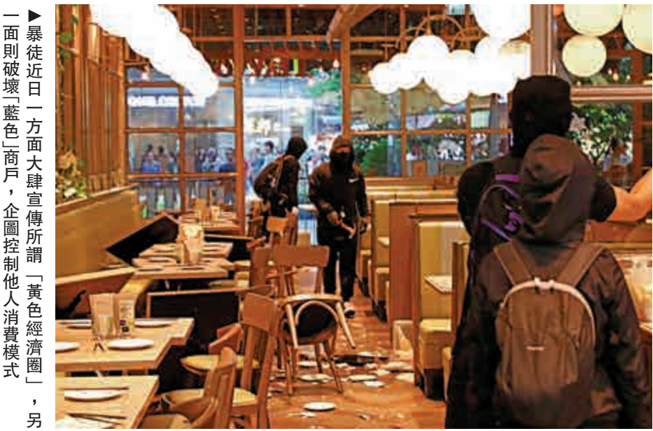
▲暴徒近日一方面大肆宣傳所謂「黃色經濟圈」，另一方面則破壞「藍色」商戶，企圖控制他人消費模式。

暴徒近日大肆宣傳所謂「黃色經濟圈」，滲透政治消費主義，實則背後暗藏政治盤算，發暴亂財，企圖控制他人消費模式。中原集團主席施永青昨日接受電台訪問時批評「黃色經濟圈」，更坦言自己受到威脅；另外在黃媒《蘋果日報》撰文多年的梁文道亦因反對「黃色經濟圈」，與《蘋果》割席及辭筆。