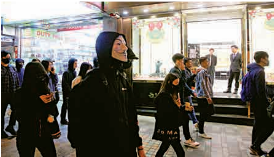
▲大批黑衣蒙面人在路上遊走，店舖不敢掉以輕心，派人在店門口把守