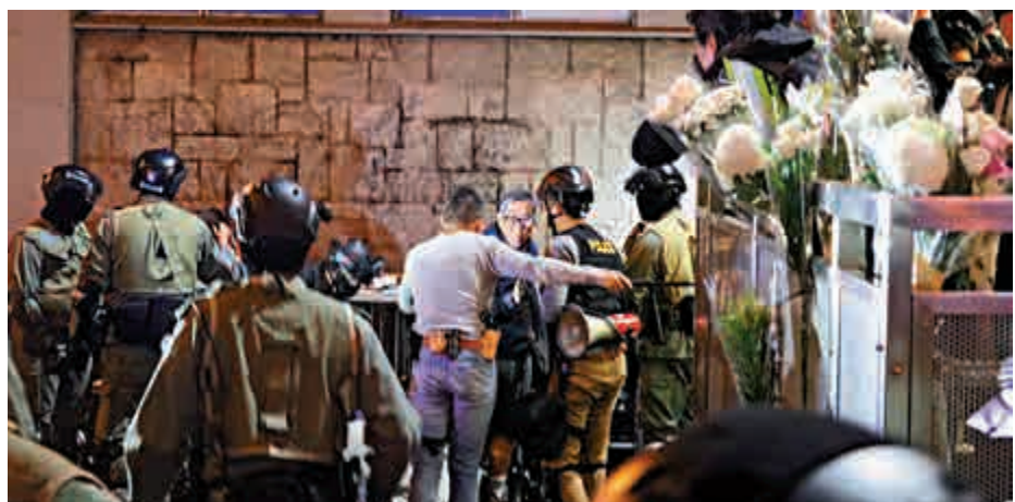
▲有搞事者在太子站外擺花，散播謠言，企圖再次挑起衝突