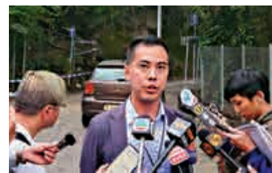
▲王爾威相信有不法之徒企圖製造汽油彈，在除夕和元旦兩日公眾活動使用，以製造恐慌