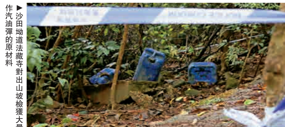
▶沙田坳道法藏寺對出山坡檢獲大量空玻璃樽及六桶電油，相信為製作汽油彈的原材料

對於有報道形容「汽油彈藏有無限溫柔」，王爾威稱，有人企圖美化事件，在執法者角度而言，汽油彈為攻擊性武器及爆炸品，目的為意圖危害他人生命，汽油彈只藏有犯罪元素。